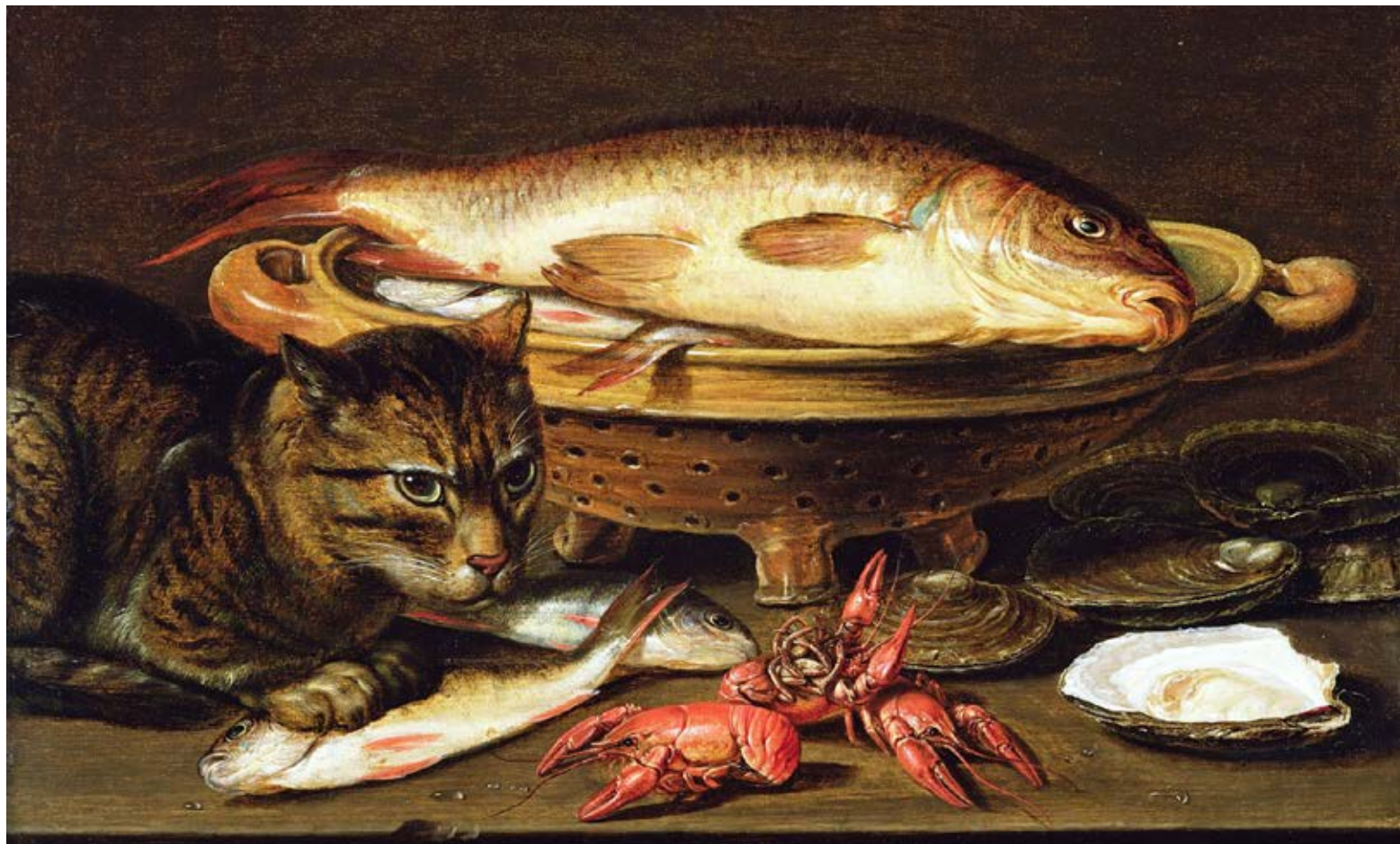
Stilleven met een karper in een keramisch vergiet, oesters, rivierkreeften, voorn en een kat | Clara Peeters | Datum onbekend | Privécollectie.

Nogal wat composities van Peeters lijken op het hier afgebeelde schilderij. De grote karper figureert met dezelfde grootte en vorm in andere van haar visstillevens, meestal gelegen bij duur exclusief eetgerei, wat de status van de karper als elitaire consumptievis extra benadrukt. ■