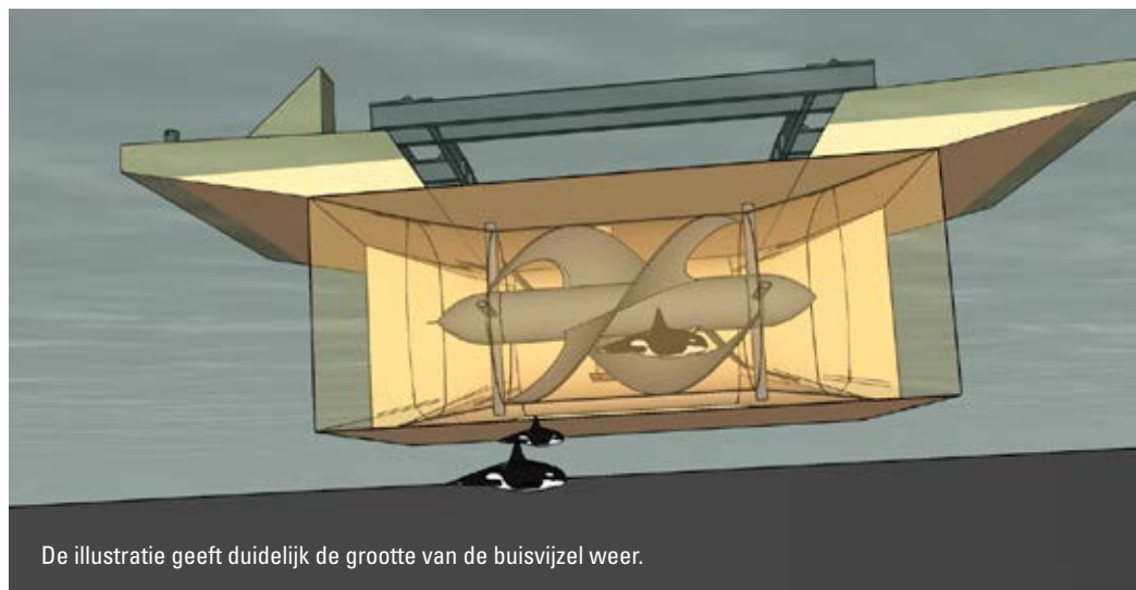
De illustratie geeft duidelijk de grootte van de buisvizel weer.

Naast schepsschroeven en vizels voor gemalen, denkt Manshanden ook vooruit richting getijdecentrales. “We zijn in onderhandeling met de Indonesische overheid om een grote getijdecentrale te bouwen onder een