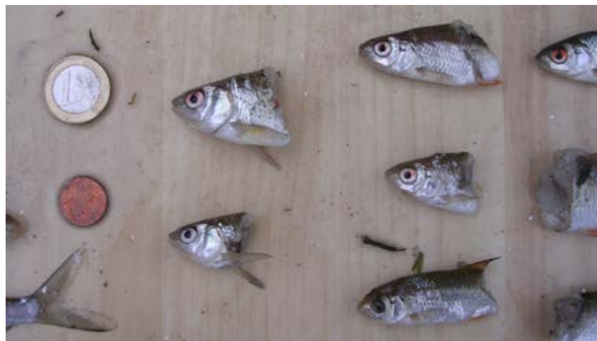
Turbines zijn helaas nog steeds levensgevaarlijk voor vissen.

Later dit jaar hoopt Mashanden samen met de Technische Universiteit Delft de eerste proeven op schaal te kunnen doen. Met zijn eigen buisvijzel als pomp én turbine wil hij met hoog rendement water uit een modelbassin als pomp én turbine wil hij met hoog rendement water uit een modelbassin als pomp en het vervolgens terug te laten stromen en daar stroom uit te