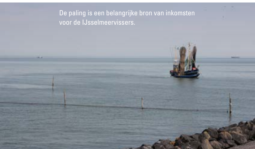
De paling is een belangrijke bron van inkomsten voor de IJsselmeervissers.

Door de invoering van het aalbeheerplan werden de vissers kwetsbaarder voor variaties in zowel visbestanden als prijzen en vermindert hun veerkracht en mogelijkheid om in te spelen op veranderingen, zoals de invoering en striktere naleving van beleidskaders in recente jaren. Sinds 2012 heeft de IJssel-meervisserij op spiering niet meer plaatsgevonden en is de capaciteit van de nettenvisserij in 2014 met 85 procent gereduceerd. Beide hebben de veerkracht verder beïnvloed.