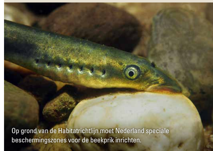
Op grond van de Habitatrichtlijn moet Nederland speciale beschermingszones voor de beekprik inrichten.

In uitzonderingsgevallen dient een beheerplan vastgesteld te worden door een minister. Zie hiervoor artikel 2.10 Wet natuurbescherming.