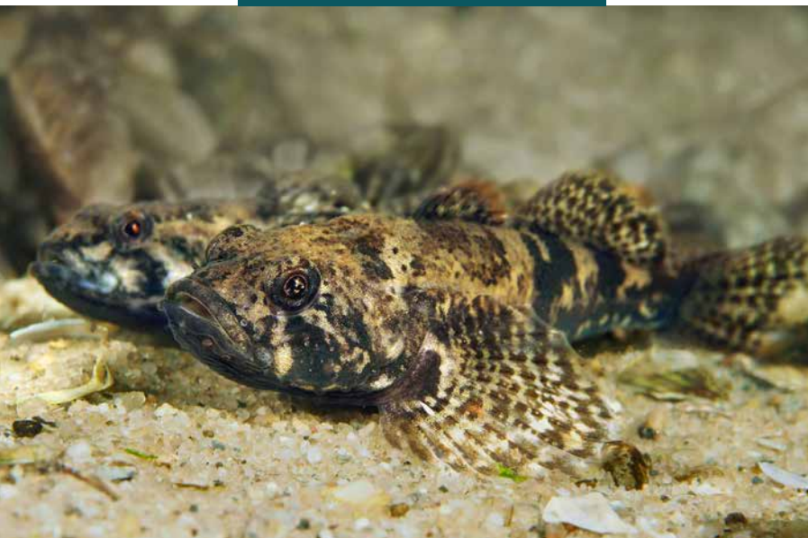
In het N2000 - beheerplan voor het IJsslemeer is slechts de rivierdonderpad aangewezen als de te beschermen vissoort.

Friese Front, Klaverbank en Wierdense Veld is ten onrechte nog geen beheerplan vastgesteld. De vraag is op welke wijze de instandhoudingsdoelstellingen van die gebieden bij het ontbreken van een beheerplan de afgelopen zes jaar zijn gewaarborgd. Ook valt het op dat de meeste beheerplannen uit 2016 dateren en dat deze vrijwel allemaal in 2021 of 2022 zonder wijziging zijn verlengd. De plannen verliezen door deze verlengde looptijd in grote mate hun connectie met de huidige omstandigheden en dit komt hun effectiviteit niet ten goede.