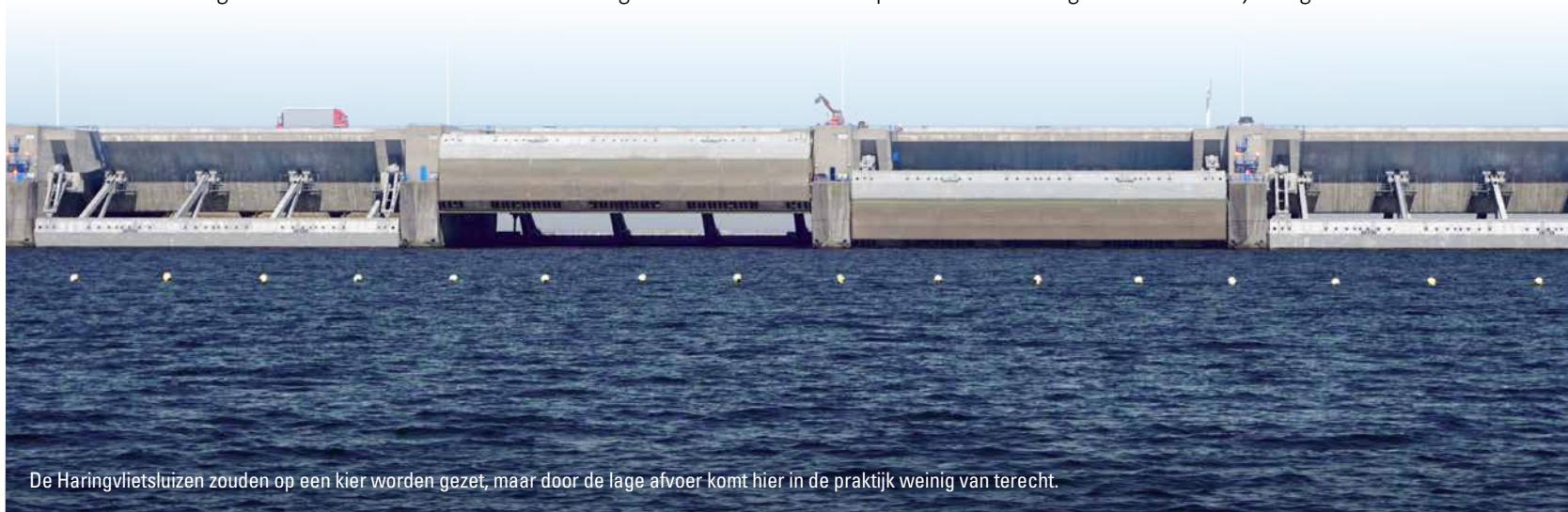
De Haringvlietsluizen zouden op een kier worden gezet, maar door de lage afvoer komt hier in de praktijk weinig van terecht.

zeeprik en dit water het voornaamste leefgebied is voor de houting. Veel N2000-gebieden zijn daarnaast aangewezen voor meerdere soorten vissen tegelijkertijd. Vanwege overlap in habitatvoorkeuren vormen de bittervoorn en kleine modderkruiper een veel voorkomende combinatie. Voor deze algemene soorten wordt meestal weinig ruimte besteed in het beheerplan en gelden meestal enkel behoud-doelstellingen. In de praktijk betekent dat, dat er voor deze soorten geen actieve maatregelen worden genomen. Voor de zeldzamere trekvissoorten zoals elft, fint, zalm en zeeprik gelden vaak wel verbeterdoelstellingen, maar de uitwerking hiervan blijft aanzienlijk vager dan voor de zoogdieren of vogels waarvoor de betreffende N200-gebieden tevens zijn aangewezen.