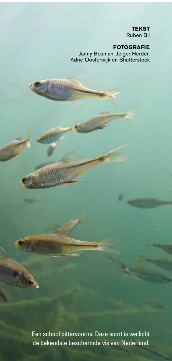
Een school bittervoorns. Deze soort is wellicht de bekendste beschermde vis van Nederland.