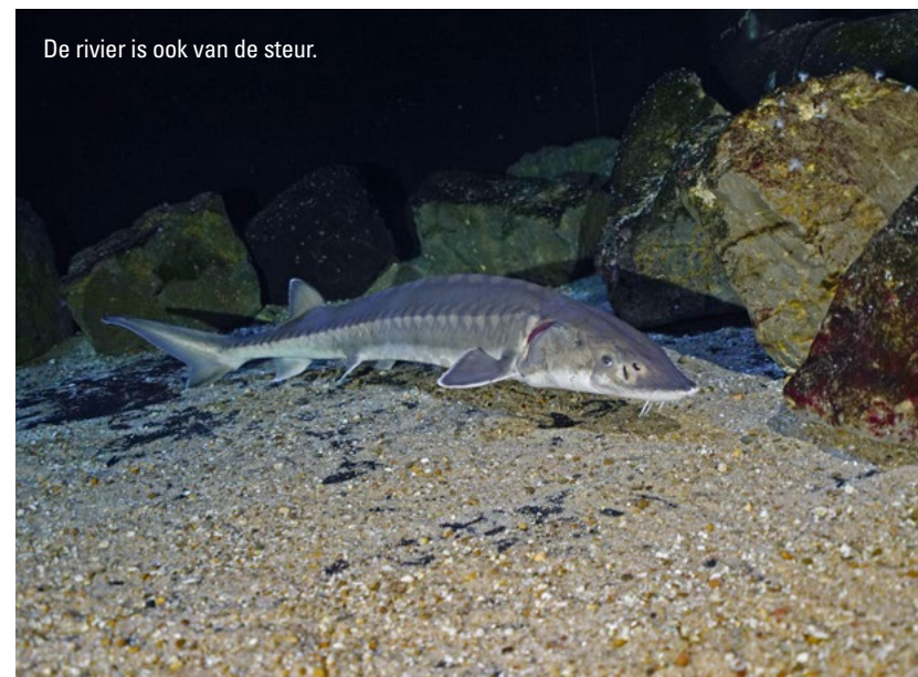
De rivier is ook van de steur.

Op die plekken waar dat nog wel het geval is, zoals in de Gelderse Poort en langs de Grensmaas, blijkt het herstelvermogen van de natuur fenomenaal. Sinds 'Ruimte voor de Rivier' zien we dat veel soorten planten, insecten en andere ongewervelden die (bijna) verdwenen waren, weer zijn teruggekeerd: brede ereprijs, zwarte populier, cipreswolfsmelk (en de hierop levende rups van de wolfsmelkpijlstaart), de rivierrombout, barbeel, meerval, rivierprik, zeearend, bever en otter. Vaak gaat het nog niet altijd om voldoende aantallen voor stabiele populaties. Voor diverse soorten dagvlinders, vissen, vogels en zoogdieren en ook de bijna uitgestorven zwarte populier, is er meer oppervlakte én robuust natuurherstel nodig. Dit kan als we dijken verleggen, in plaats van te versterken en daarmee tussen de dijken alle uiterwaarden tot natuur om te vormen. Dit zorgt tot de zo belangrijke ruimte die de riviernatuur gewoon nodig heeft. Samengevat gaat het om meer fysieke ruimte voor natuur in het rivierengebied. Dat is noodzakelijk om voldoende draagkracht voor populaties van soorten te bieden. Maar ook om meer functionele ruimte voor natuurlijke processen zoals