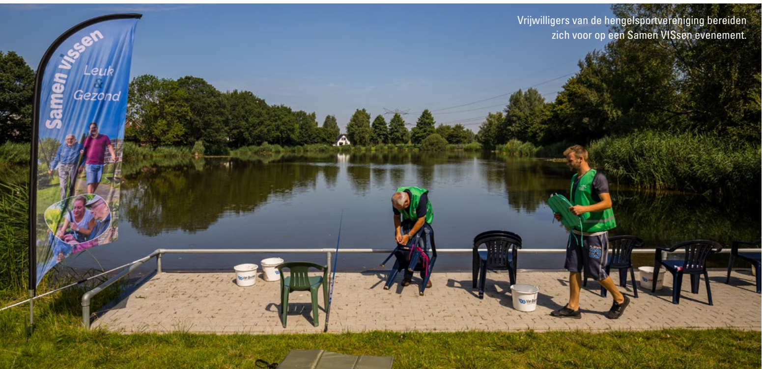
Vrijwilligers van de hengelsportvereniging bereiden zich voor op een Samen VISsen evenement.

weer eens lekker te vissen, net als vroeger. De meeste waarde ervaren deelnemers binnen het 'mentaal welbevinden'. De rust, maar ook even geen zorgen hebben over de beperkingen die zij normaal ervaren. Ook het 'meedoen' speelt een grote rol. De sociale contacten, weer even buiten het verzorgingstehuis zijn; deelnemers voelen zich weer onderdeel van de maatschappij. ■