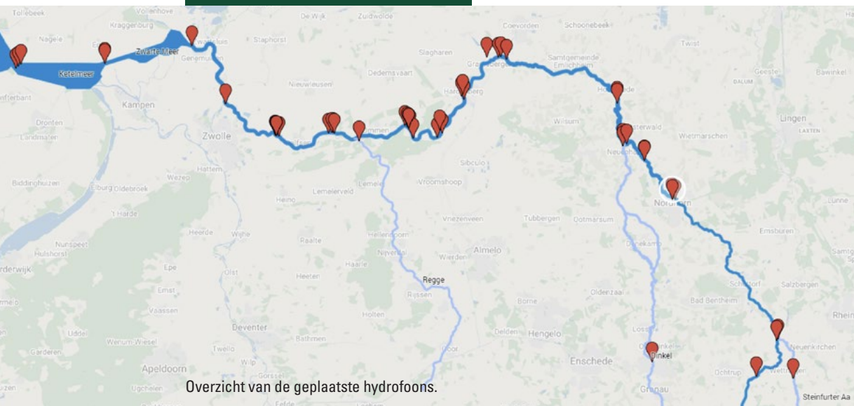
Overzicht van de geplaatste hydrofoons.