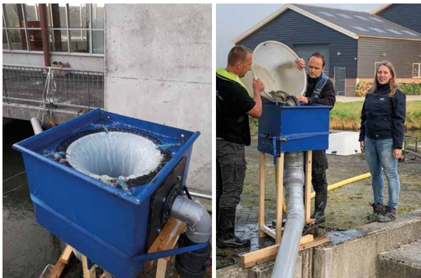
De speciale gebouwde vis invoerconstructie.

Gemaal Krimpenerwaard ligt aan de Lekdijk West in Bergambacht en vormt de verbinding tussen het waterlichaam Bergambacht en de rivier de Lek ten zuiden van het beheergebied. Het gemaal speelt een cruciale rol in de waterhuishouding van het achterliggende poldergebied. Omdat het volledige beheergebied van het waterschap onder zeeniveau ligt, is het gemaal onmisbaar om te voorkomen dat het gebied onder water komt te