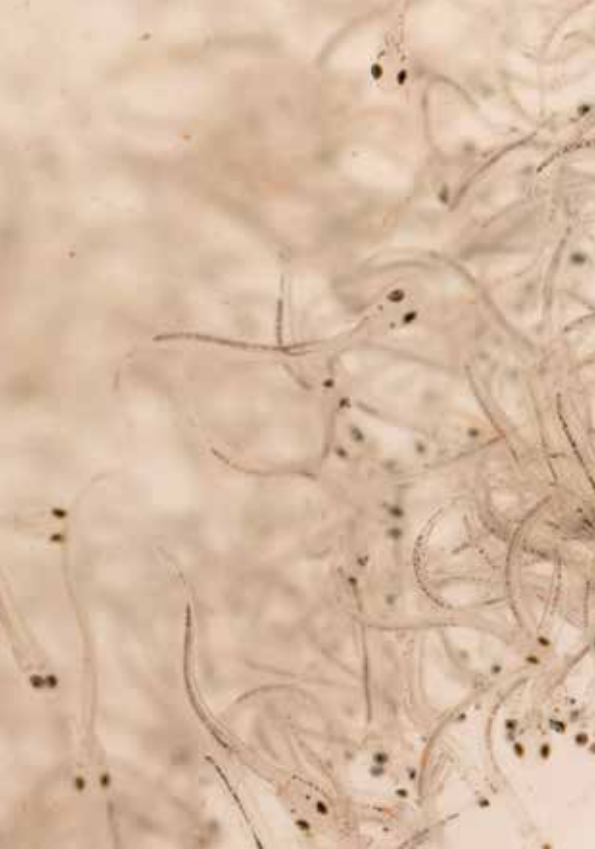
Elftlarven vlak voordat ze worden uitgezet.

larven per jaar. Zo denkt hij een zelfstandige populatie elften in de Rijn op te kunnen bouwen. Verder worden de specifieke paaigebieden van de elft in kaart gebracht met de inzet van voice-recorders langs de rivier. De elft spat tijdens de paai met de staart luidruchtig op het water, waarbij ze in kringetjes rondzwemmen, gedrag dat ze bij voorkeur in het holst van de nacht vertonen. Paailocaties van de nieuwe lichte van volwassen elften zijn onder andere gevonden bij een eiland in de Rijn bij Düsseldorf en in de monding van de Main in de Rijn.