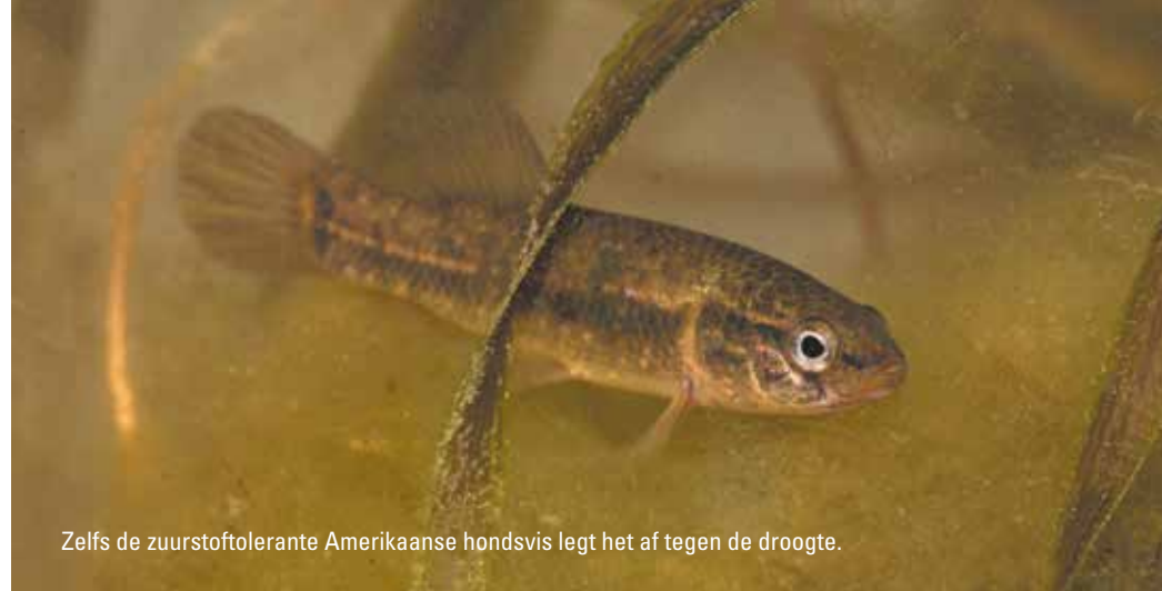
Zelfs de zuurstoftolerante Amerikaanse hondsvij legt het af tegen de droogte.

Diverse waterschappen verrichtten in 2018 samen met sportvissers afvisacties in poelen bij bruggen, duikers en stuwen in droogvallende beken. De gevangen vissen zijn overgezet naar visvijvers, kanalen en grotere, niet-droogvallende beken. Bij deze acties viel op dat vooral de plantminnende soorten zeelt, rietvoorn en snoek en de exoot zonnebaars, een goede overlevingskans hadden in de poelen en daar nog in relatief grote aantallen aanwezig waren. De vangstgegevens op de nat-droogtrajecten bevestigen dat de plantminnende soorten zeelt, rietvoorn en snoek minder te lijden hadden van de droogte. Voor zeelt en rietvoorn nam de gemiddelde vangst per traject in de droge periode zelfs toe. Overigens is de toename van rietvoorn het gevolg van een grote vangst op slechts één traject. Vermoedelijk nam de populatie rietvoorn dan ook niet daadwerkelijk toe, maar geeft de bemonstering een vertekend beeld door het toevallig aantreffen van een hoge concentratie. Plantminnende soorten als zeelt en rietvoorn zijn goed in staat om