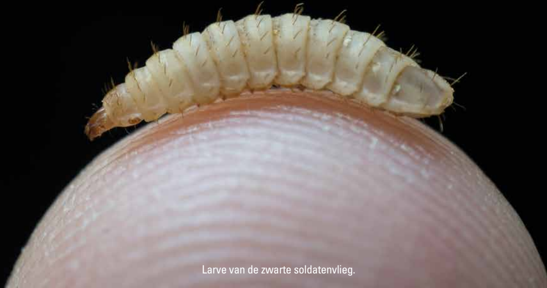
Larve van de zwarte soldatenvlieg.