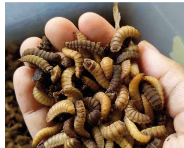
Kratten met meelwormen in het insectenlab.

Larven van de zwarte soldatenvlieg zijn een eiwitbron voor commercieel zalmvoer.