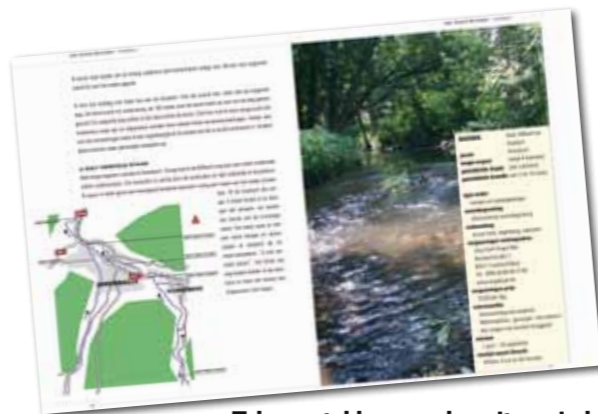
Tal van stekken worden uitvoerig beschreven.

Ook in dit boek toont Wanders zich weer een waardevolle gids. Waar kun je vergunningen kopen, wat kosten die, wat zijn de voorwaarden, wat is de beste seizoensperiode, wat zijn de reistijden, kun je in de buurt overnachten en waar vind je de diverse websites van de betreffende vergunningverstrekkers? Achterin het boek staan volledig herziene en up-to-date beschrijvingen van de diverse wateren. Je kunt dus kortom bijna alles te weten komen over een bepaald water, zodat een vergeefse vistrif zo goed als zeker kan worden voorkomen. De auteur heeft alle wateren die hij beschrijft ook zelf bevestigd en geeft