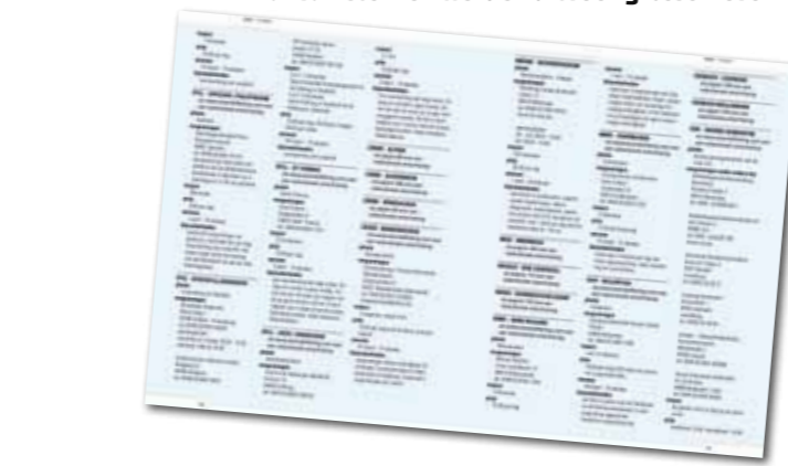
Het register bespaart je een hoop brandstof- en telefoonkosten.

Vliegvisser in Duitsland bevat alles wat je moet weten voor een goed voorbereide Duitslandtrip.