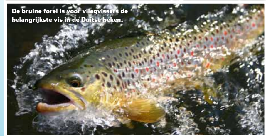
De bruine forel is voor vliegvisseren de belangrijkste vis in de Duitse beken.

In de Duitse beken hebben we het vooral gemunt op forel - bruine forel en soms ook regenboogforel - en vlagzalm. Vlagzalm was vroeger de meest voorkomende vissoort, maar door de aalscholver zijn de Duitse vlagzalmbestanden gedecimeerd. In veel beken is het ook mogelijk om barbeel te vangen. Zeker in het voorjaar worden deze geregeld gevangen aan verzwaarde nimfen. En als je zo'n krachtpatser aan de haak hebt, weet je niet wat je overkomt.