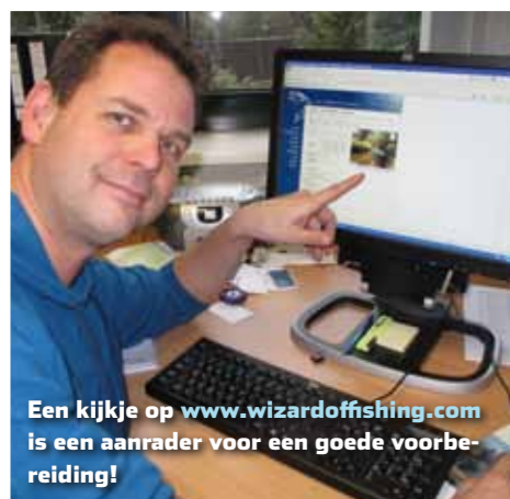
Een kijkje op www.wizardoffishing.com is een aanrader voor een goede voorbereiding!

Verkooppunten van de vergunning voor het beektraject dat jij voor ogen hebt, kun je het beste op internet zoeken. Dat kan via Google, maar de website www.wizardoffishing.com biedt veruit de meeste informatie; bijna 60 Duitse stukken beek waarvoor je een vergunning kunt krijgen, inclusief extra info over overnachtingen, vergunningsvoorwaarden etc. Daarnaast is via deze website een stekkenboek te verkrijgen met nog meer adressen en stekentips voor Duitsland. Een echte aanrader. Op verschillende beken wordt een maximaal aantal vergunningen per dag uitgegeven. Bel daarom van tevoren om vergunningen te reserveren, zodat je er niet voor niets heen gaat.