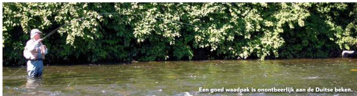
Een goed waadpak is onontbeerlijk aan de Duitse beken.

Om effectief in een beek te kunnen vissen is waden noodzakelijk. Daarvoor kun je lieslaarzen of een waadpak aanschaffen. Het waadpak heeft daarbij het voordeel dat je wat dieper in het water kunt lopen. Let wel op! De druk van stromend water is groot en je wordt gauw van je voeten geduwd. Het lekkerst is een ademend waadpak en schoenen met viltzolen. Door de viltzolen glijd je niet zo snel uit over gladde stenen. Let wel op dat (nat) gras wel erg glad is met dit type zool. Vis als het even kan trouwens altijd eerst het stuk water voor je voeten af, alvorens je met waadpak en al het water inbanjert.