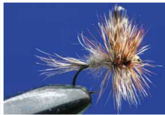
Maak een beperkte selectie vliegen, maar neem van elke soort wel meerdere maten mee.

Er zijn ongelooflijk veel soorten vliegen. Maak een selectie van een beperkt aantal vliegen en zorg ervoor dat je van één type vlieg meerdere formaten meeneemt naar Duitsland. Dus beter alleen een Adam's in de maten 12, 14, 16 en 18 dan vier verschillende soorten vliegen in dezelfde maat. Kies in het begin een klein aantal typen droge vliegen, in verschillende kleuren. Je collectie zal langzamerhand toch wel gaan uitbreiden.