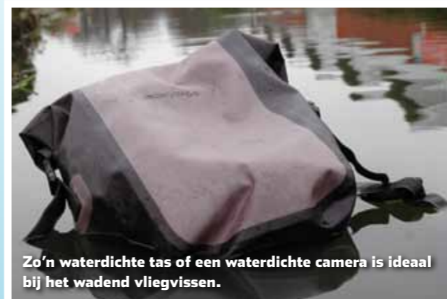
Zo'n waterdichte tas of een waterdichte camera is ideaal bij het wadend vliegvisen.

Een mooie herinnering aan die enorme vis of prachtige omgeving leg je het beste vast op een mooie foto. Bedenk wel dat je vissend in het water staat en dat camera's en water erg slecht samengaan. Tegenwoordig zijn er waterdichte camera's die je prima zo in je vliegvisvest kan steken. Als je een spiegelreflex meeneemt, is het aan te bevelen om een waterdichte tas aan te schaffen en daar je camera in te bewaren tijdens het vissen.