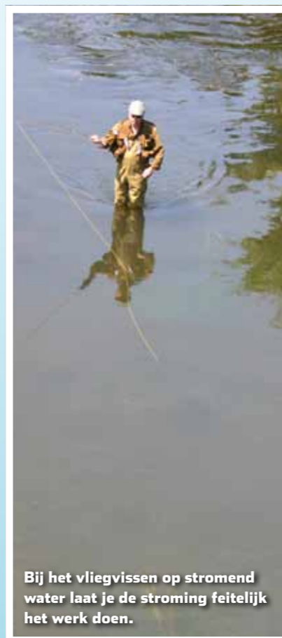
Bij het vliegvisseren op stromend water laat je de stroming feitelijk het werk doen.

De vlieghengel biedt op stromend water de mogelijkheid om de vlieg (een imitatie van het natuurlijk voedsel) nauwkeurig en snel op de goede plek te presenteren. De stroming brengt het eten bij de vis die op een gunstige standplaats (onder overhangende takken, achter stenen of onder een schaduwrijke oever) staat. Maak gebruik van de stroming door de vlieg een paar meter stroomopwaarts van de hotspot te werpen en laat de stroming de vlieg meevoeren naar de vis.