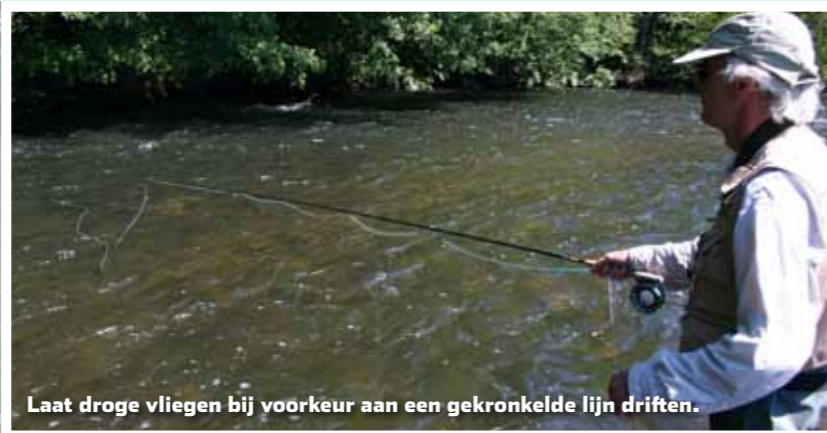
Laat droge vliegen bij voorkeur aan een gekronkelde lijn drijven.

Voor veel vliegvisser is vissen met de droge vlieg de favoriete methode. Logisch, want het is een schitterend gezicht als de droge vlieg op de stroming meedrijft en vervolgens wordt gepakt. De droge vlieg wordt bijna altijd stroomopwaarts gepresenteerd. De kunst is om de vlieg zo ongestoord mogelijk met de stroming mee te laten drijven, zonder dat deze door de vliegenlijn wordt meegetrokken. Dat kun je doen door een 'losse' lijn te werpen. Dus geen kaarsrechte lijn, maar een lijn die ietwat gekronkeld op het water valt.