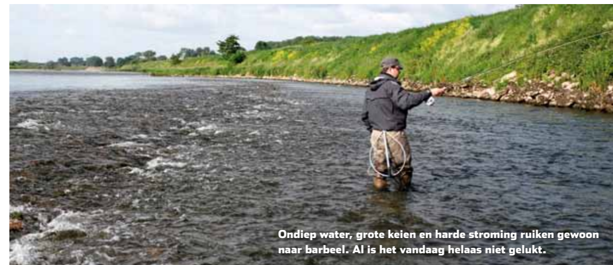
Ondiep water, grote keien en harde stroming ruiken gewoon naar barbeel. Al is het vandaag helaas niet gelukt.

De barbeel waarvoor we op pad gingen werd niet gevangen, maar de gevarieerde vangst toont wel aan dat de Grensmaas een bijzonder water is waar je alles kunt verwachten. Soorten als roofblei, barbeel en kopvoorn komen algemeen voor en met een beetje geluk maak je zelfs kans op een fraaie forel of een sneep. Het is niet alle dagen prijs, maar wat je vangt is vaak wel écht de moeite waard!