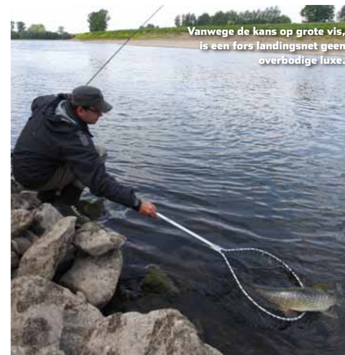
Vanwege de kans op grote vis, is een fors landingsnet geen overbodige luxe.

Tijd om te verkassen naar de volgende stek. Het gedeelte dat we nu aandoen is weer een snelstromend deel van de Grensmaas. Het ondiepe water met grote keien en de harde stroming zorgen ervoor dat het hier gewoon ruikt naar barbeel en roofblei. De nimf en beetverklikker worden er weer aangeknoopt in de hoop een barbeel te haken. Dat valt echter vies tegen. Ook de roofbleien laten zich niet zien en de moed zakt ons langzaam in de schoenen. Zou het dan toch door die lage waterstand komen? “Maar waar houden ze zich dan op”, vraagt Vincent zich vertwijfeld af. Het is inmiddels laat in de middag en de tijd begint te dringen. Omdat we toch graag een barbeel