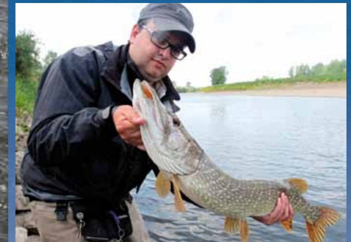
Snoek zwemt hier tot behoorlijke afmetingen.

DIT KUN JE VANGEN De Grensmaas biedt gevarieerde vliegvismogelijkheden. Hieronder een greep uit de mogelijke vangsten. En daar zitten de barbeel, kopvoorn, winde en bruine forel dan nota bene nog niet eens bij.