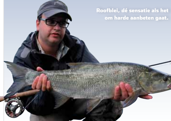
Roofblei, dé sensatie als het om harde aanbeten gaat.