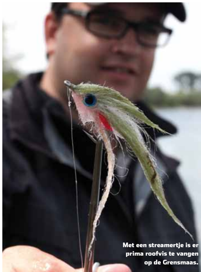
Met een streamertje is er prima roofvis te vangen op de Grensmaas.

diepe plekken op en daar kom je met de vlieghengel maar moeilijk bij.”