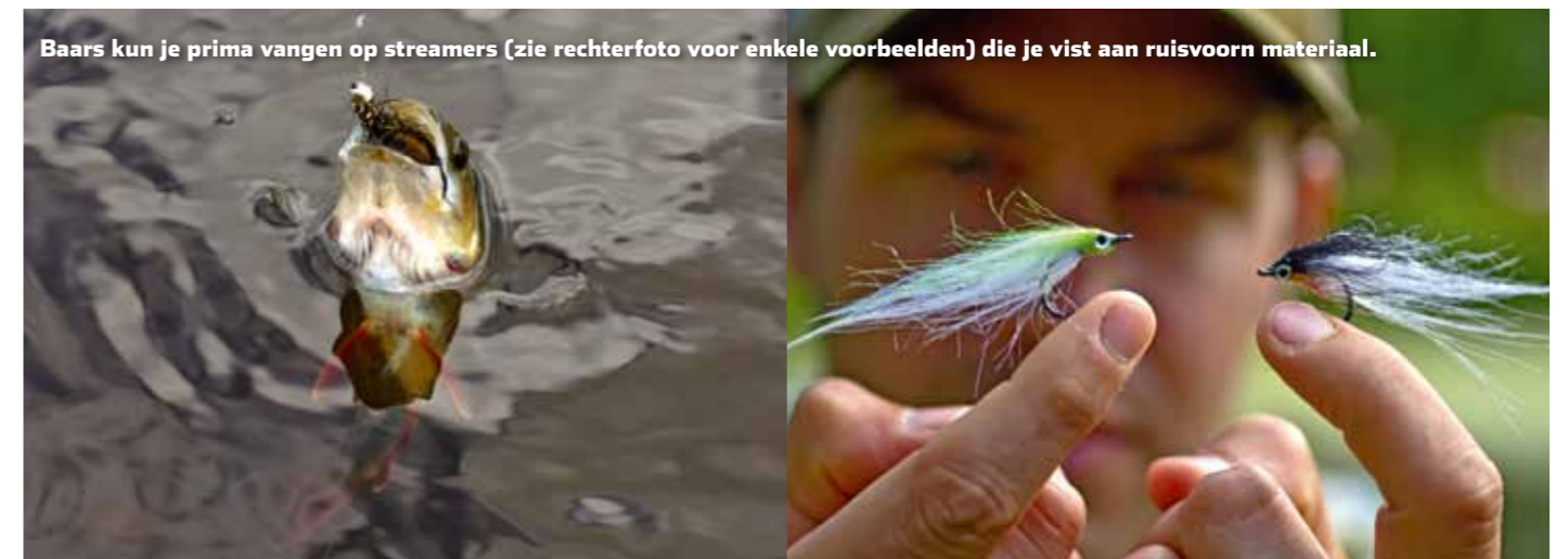
Baars kun je prima vangen op streamers (zie rechterfoto voor enkele voorbeelden) die je vist aan ruisvoorn materiaal.