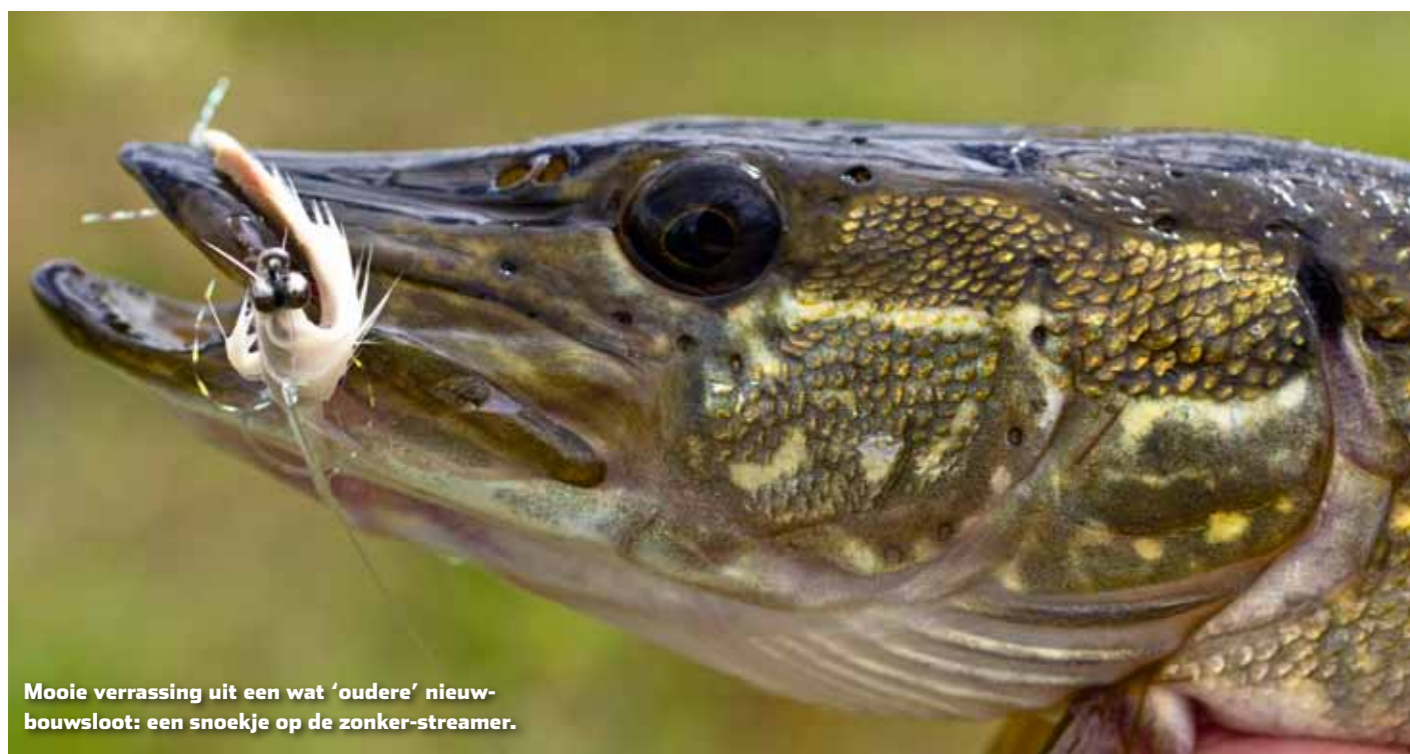
Mooie verrassing uit een wat ‘oudere’ nieuwbouwsloot: een snoekje op de zonker-streamer.