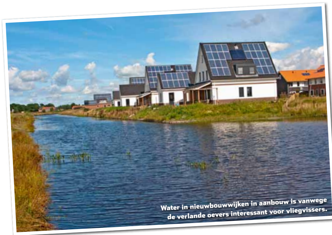
Water in nieuwbouwwijken in aanbouw is vanwege de verlande oevers interessant voor vliegvisser.

voorhanden. Nu de voorns het laten afweten, probeer ik het bijvoorbeeld op roofvis. Ook dat kan met een lichte vliegvisuitrusting. De extra doos met kleine streamertjes en intermediale (zeer langzaam zinkende) lijn die ik bij me heb, komen nu van pas.”