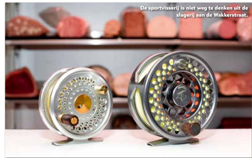
De sportvisserij is niet weg te denken uit de slagerij aan de Wakkerstraat.