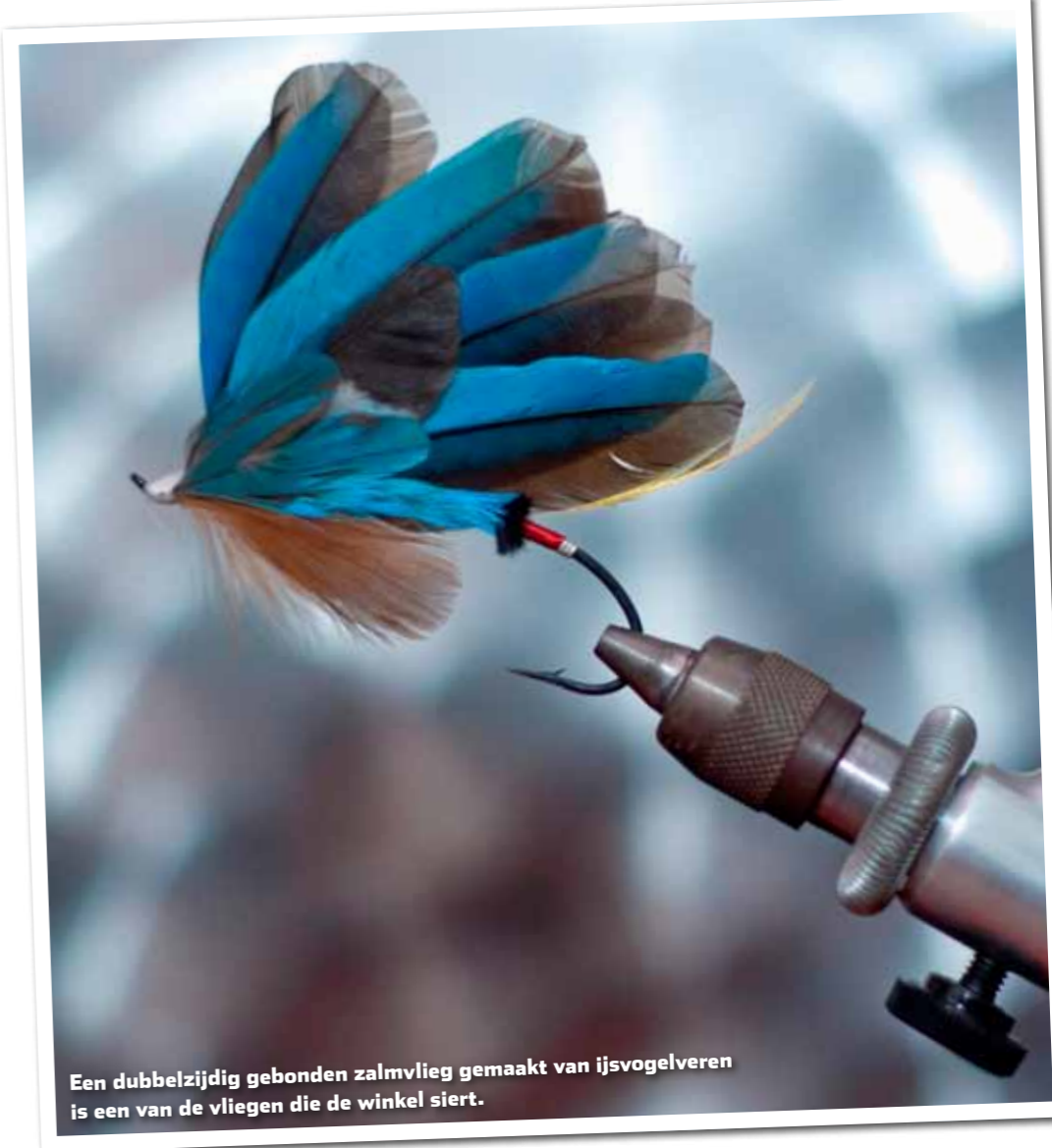
Een dubbelzijdig gebonden zalmvlieg gemaakt van ijsvogelveren is een van de vliegen die de winkel siert.

Uit die tijd stamt ook zijn voorliefde voor het binden van (dubbelzijdige) zalmvliegen. “Dat doen we geregeld met een klein groepje liefhebbers. Gezellig met zijn allen samen, een biertje erbij en binden maar. Op een avond dat we echt veel lol hebben, komt zo’n vlieg dan soms niet eens af.” Na al die jaren binden heeft de slager een hele beste verzameling bij elkaar geknutseld. Gevist wordt er echter niet met de zalmvliegen. “Dat doe je niet. Die zijn gemaakt voor in de lijstjes, puur voor de show.”