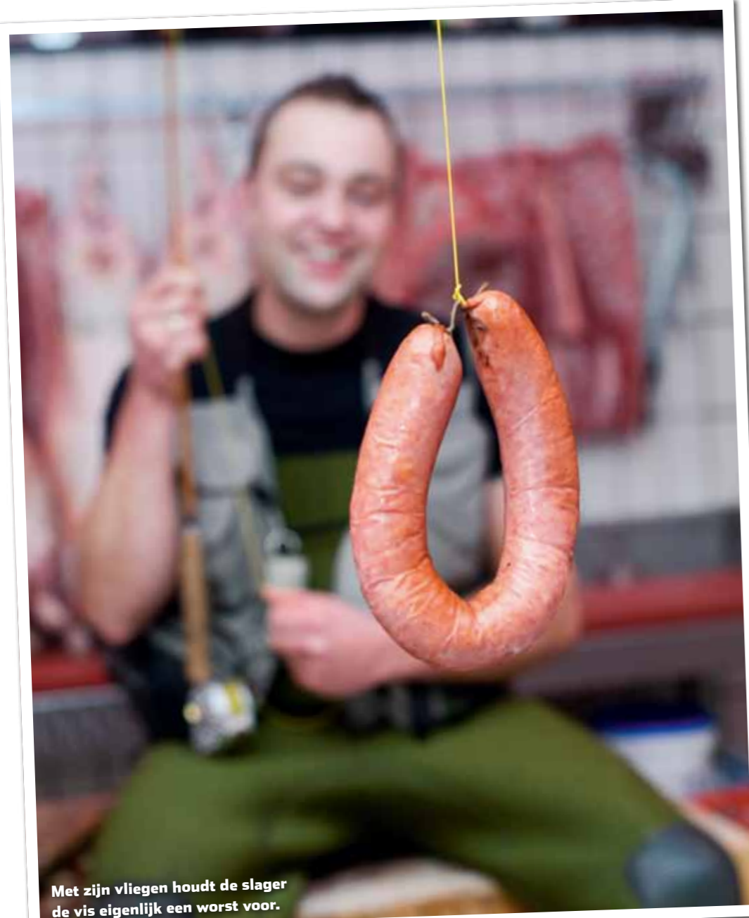
Met zijn vliegen houdt de slager de vis eigenlijk een worst voor.

Enkele vliegen sieren ook de winkel, al zijn ze niet prominent aanwezig. “We zijn in de eerste plaats natuurlijk wel een slagerij en geen hengelsportzaak.”