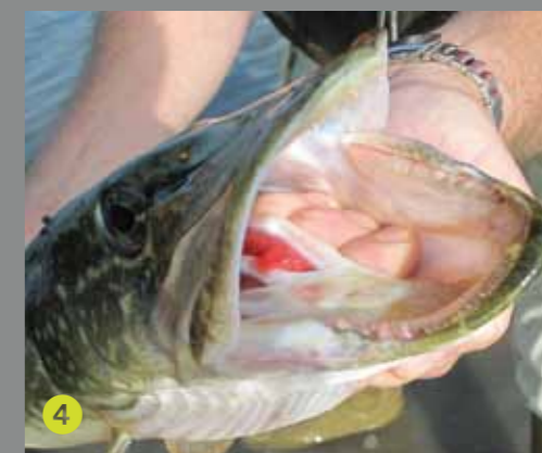
4 Direct links van de vingers zie je de eerste kieuwboog. Pas goed op dat je daar niet tussen komt met je vingers.

deksel aan – zodat ze niet tussen de scherpe kieuwbogen terecht komen – en schuif ze naar voren toe, richting de punt van de onderkaak. Totdat de vingers niet verder kunnen. Dan maak ik een vuist, waarbij mijn vingers tot voorbij de vingerkootjes verstopt zitten in de kieuw. Ook de duim – de enige vinger die nog buiten de kieuw zit – vouw ik naar binnen. Een uitstekende duim zou anders in aanraking kunnen komen met de vele tandjes.