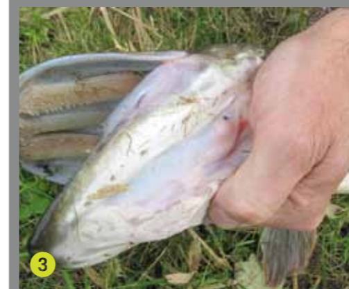
3 Maak nu een vuist. Houd ook je duim tegen je hand aan, zodat deze niet via de buitenkant tegen een van de tandjes aan kan komen.