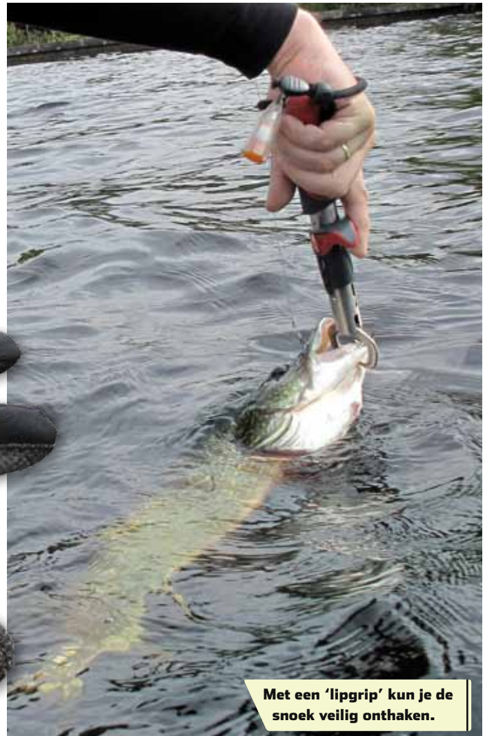
Met een 'lipgrip' kun je de snoek veilig onthaken.

blote hand de snoekenbek in, dan kun je de techniek ook eerst aanleren door met een speciale onthaakhandschoen te oefenen. Die zijn er tegenwoordig volop op de markt. Kies bij voorkeur een dunne, soepele versie waarbij je goed blijft voelen waar je vingers tegenaan komen. Wil je helemaal alle risico's uitsluiten, haal dan eerst het kunstas uit de bek en doe pas daarna de kieuwgreep. Dat