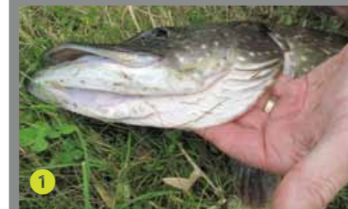
1 Til met vier vingers de kieuwdeksel omhoog en houd je vingers stijf tegen de binnenkant van de kieuwdeksel aan.