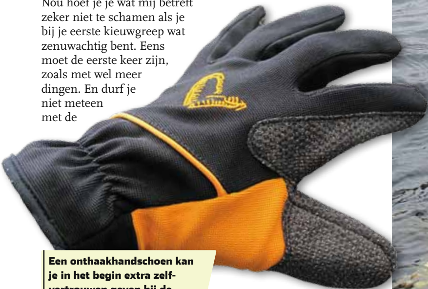
Een onthaakhandschoen kan je in het begin extra zelfvertrouwen geven bij de kieuwgreep.