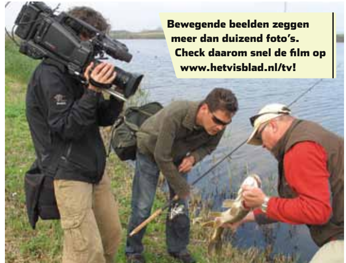
Bewegende beelden zeggen meer dan duizend foto's. Check daarom snel de film op www.hetvisblad.nl/tv/ !

kan door de vis in het water achter de kop vast te pakken, maar ook door de snoek met een zogenaamde 'lipgrip' in de onderkaak te klemmen. Laat de vis daarbij aan de lipgrip in het water liggen en til de vis er nooit(!) aan op. Heb je het kunstas verwijderd, dan kun je de vis veilig met de kieuw-