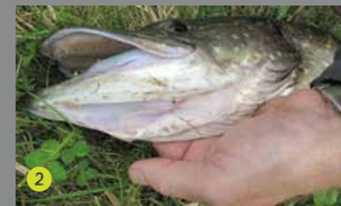
2 Schuif de vingers nu naar voren, totdat het niet verder kan.