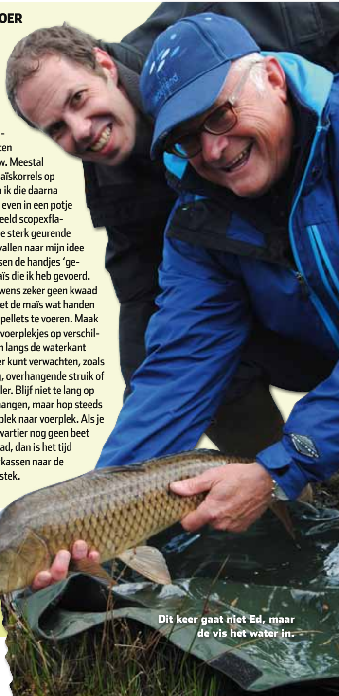
Dit keer gaat niet Ed, maar de vis het water in.

Karpers zijn alleseters, maar zoete maïs uit blik stelt wat mij betreft alle andere mogelijke aassoorten in de schaduw. Meestal zet ik twee maïskorrels op de haar en dip ik die daarna vaak nog wel even in een potje met bijvoorbeeld scopexflavour. Die twee sterk geurende maïskorrels vallen naar mijn idee direct op tussen de handjes 'gewone' blikmaïs die ik heb gevoerd. Het kan trouwens zeker geen kwaad om samen met de maïs wat handen kleine karpelletts te voeren. Maak hiermee wat voerplekjes op verschillende plekken langs de waterkant waar je karper kunt verwachten, zoals een rietkraag, overhangende struik of een brugpijler. Blijf niet te lang op één plek hangen, maar hop steeds van voerplek naar voerplek. Als je na een kwartier nog geen beet hebt gehad, dan is het tijd om te verkassen naar de volgende stek.