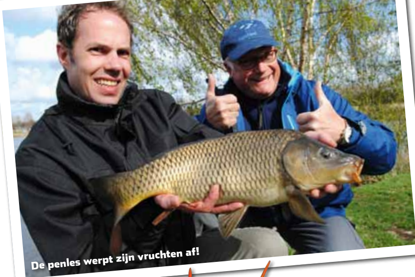
De penles werpt zijn vruchten af!