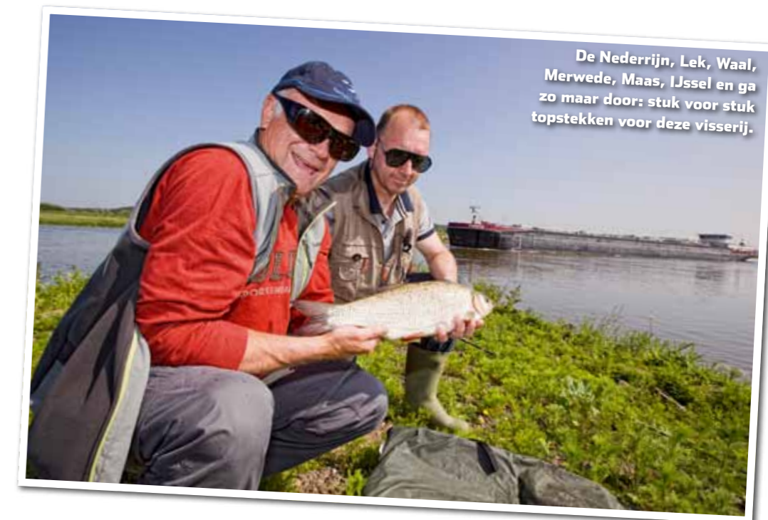
De Nederrijn, Lek, Waal, Merwede, Maas, IJssel en ga zo maar door: stuk voor stuk topstekken voor deze visserij.