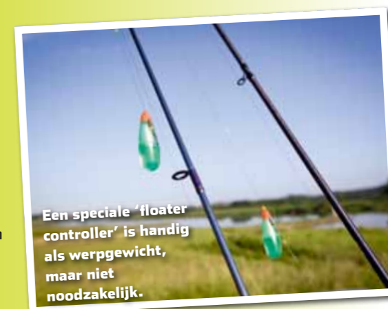
Een speciale 'floater controller' is handig als werpgewicht, maar niet noodzakelijk.

Windes zijn prachtige vissen die leuk kunnen springen tijdens de drill. Het is echter ook weer niet zo dat ze tijdens de drill meters lijn van je molenspoel zouden raggen. Daarom heb je genoeg aan een lichte spinhengel of een mooie zachte penhengel. Daarop een werpmolen in de 2500- of 3000-serie met 20/00 nylon of een 10-ponds gevlochten lijn met een voorslag van nylon als schokbreker. Voordeel van gevlochten lijn is dat deze drijft en je op afstand beter een haak zet dan met nylon. Aan het einde van de hoofdlijn komt slechts een werpdobber (een zogenaamde 'floater controller'). Onder de controller komt de 80 tot 100 cm lange onderlijn van 18/00 of 20/00 nylon of fluorocarbon, met daaraan een flinke haak met wijde bocht en korte steel in maat 6 of 8. De broodkorst wordt in een elastiekje geklemd dat om de haakbocht zit. Denk verder aan een goed landingsnet en een onthaakmatje om de vis op de krib 'schadevrij' te kunnen onthaken.