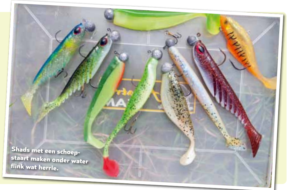
Shads met een schoepstaart maken onder water flink wat herrie.

Hoewel de laatste snoekbaars die een spinner of plug niet pakt nog moet worden geboren, zijn shads voor deze visserij toch het aangewezen kunstaas. Omdat we – in tegenstelling tot de bootvissers die verticaal – werpend vissen, kiezen we in het bijzonder voor shads met een schoepstaart. Die veroorzaken als ze over de bodem hobbelen meer turbulentie dan V-staartjes of rechte staarten zoals snugs en slugs. Neem de shads in lengtes van 10 tot maximaal 15 cm. Over kleuren kunnen we urenlang discussiëren. Belangrijk is dat je zowel wat donkergekleurde (bijvoorbeeld bruin) als lichtgekleurde shads (wit, geel, roze of een combinatie van lichte kleuren) bij je hebt. Overigens is mijn favoriete kleurcombinatie groen met geel.