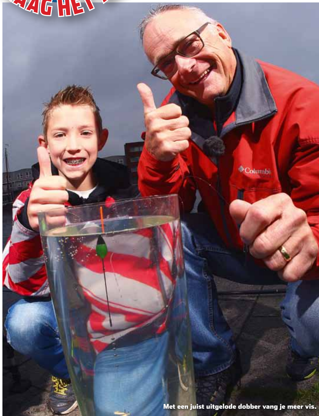
Met een juist uitgelode dobber vang je meer vis.