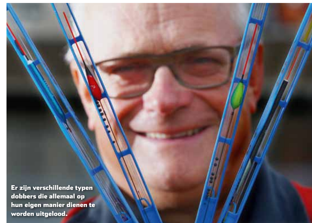
Er zijn verschillende typen dobbers die allemaal op hun eigen manier dienen te worden uitgelod.

of stroming kun je het kleinste hageltje namelijk op de bodem laten rusten, zodat de pen niet door wind en stroming wordt meegevoerd. En de vis hoeft dan geen gewichtheffer te zijn om dit loodje van de bodem te tillen. Een klein loodhageltje wekt dus minder argwaan dan een grote loodbal.