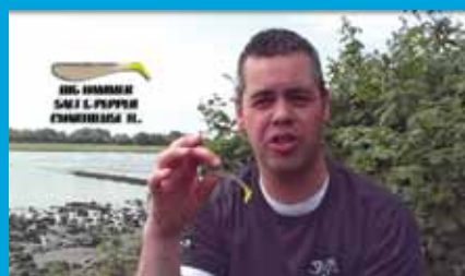
Goede uitleg over de te gebruiken shads en loodkoppen.