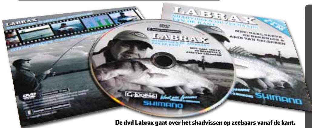
De dvd Labrax gaat over het shadvissen op zeebaars vanaf de kant.