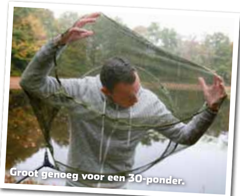
Groot genoeg voor een 30-ponder.

Hoewel het Folding Spoon Net geschikt is voor alle universele schepnetstelen met ingang voor een schroefdraad, is de Xpert Multi-Handle 3 m steel van Korum een aanrader. Deze bestaat uit twee delen: een steel van 1.3 meter lengte (ideaal voor scheppen in de boot) en een van 1.8 meter (de reguliere steellengte). Je kunt de fraai afgewerkte carbon stelen ook in elkaar passen, waarmee je een 3 meter stok creëert. Ideaal voor hogere kades, kribben of andere lastige stekken. De steel heeft een adviesprijs van €74,95, zodat je met net voor onder de 100 piek een hele mooie set hebt. Het net wordt geleverd inclusief stank- en slijmwerend foudraal. Gezien bij Fauna Hengelsport in Raamsdonkveer ( www.hengelsportfauna.nl ). Meer info: www.korum.co.uk .