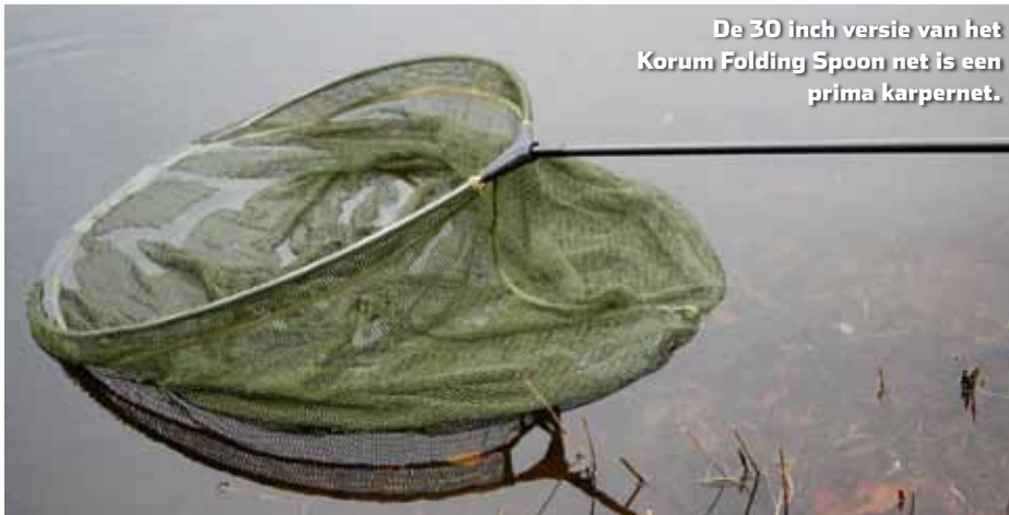
De 30 inch versie van het Korum Folding Spoon net is een prima karpernet.

Het landingsnet vormt niet zelden een bron van ergernis. Ze zijn vaak onhandig groot, te slap en zwaar als het net in het water ligt. Het Folding Spoon Net van Korum biedt uitkomst.