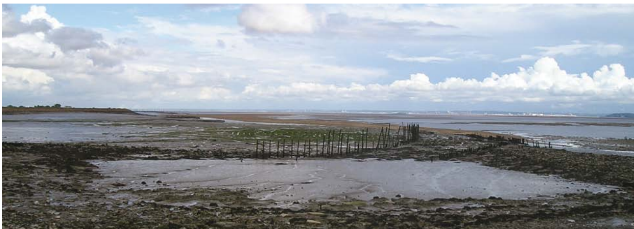
Het estuarium van de Severn dreigt te worden opgeofferd aan de winning van waterkracht.

niet te stoppen lijkt. De ecologen zoeken houvast in de Europese water- en natuurregelgeving, maar ondertussen vordert de bouw. Daarbij functioneert tachtig procent van de vispassages die bij dammen worden aangelegd niet naar behoren. De kennis hierover staat in Oost Europa nog in de kinderschoenen. Niet zo verwonderlijk als je bedenkt dat bij waterbeheerders in Polen drie ecologen aan vismigratie werken, tegenover bijvoorbeeld meer dan veertig op hetzelfde vakgebied in het veel kleinere Nederland. Hoopvol is de ontwikkeling dat het Wereld Natuur Fonds met de Poolse overheid overlegt om een aantal rivieren te sparen. De gesprekken zijn in volle gang, maar de vraag is welke belangen de Poolse overheid voor laat gaan.