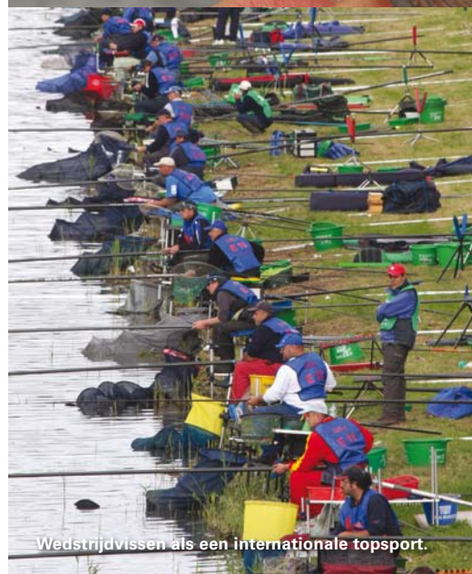
Wedstrijdvisserij als een internationale topsport.