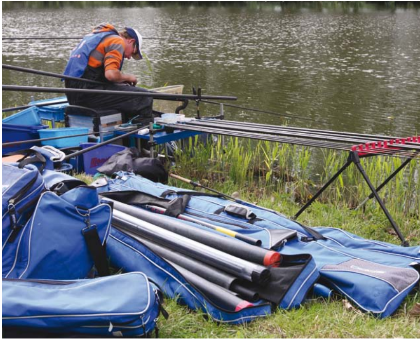
High tech hengels van 5000 euro en meer.

verschillende categorieën. Zo zijn er de vissers die op verenigingsniveau vissen: onderlinge wedstrijden binnen een vereniging. Daarnaast zijn er vissers die meedoen aan de landelijke competitie in bepaalde regio's. De absolute top in de sportvisserij is het meedraaien in de 'Nationale Topcompetitie'. Sportvisserij Nederland schrijft deze selectiewedstrijden uit en de winnaars daarvan worden uitgezonden naar verschillende kampioenschappen, zoals het EK en WK.