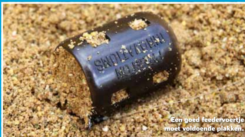
Een goed feedervoertje moet voldoende plakken.

Een goed feedervoertje moet voldoende plakken en pas op de bodem loskomen uit de voerkorf. Je hebt keuze uit een kant-en-klaar feedervoer uit de hengelsportwinkel, of je stelt het voer zelf samen. Dat laatste is natuurlijk wel zo leuk. Wat heb je nodig: 4 delen (kopjes of bekers) bruin broodmeel, 3 delen zoet maïsmeel, 2 delen koekmeel, 1 deel pv-collant en 2 eetlepels gemalen koriander. Maak het feedervoer voldoende vochtig, zodat het goed plakt. Zeef het voer vervolgens met een voerzeef, zodat er geen grote klonten meer in zitten. Stop tot slot ook altijd datgene in het feedervoer dat ook als aas aan de haak zit. Denk aan maden, madepoppen (casters), hele of geknipte wormen en/of maïs. Altijd goed om de vis extra bezig te houden op je stek!