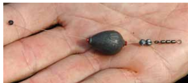
Onder het tonwarteltje komt de schokbreker van 20/00 mm fluorocarbon met onderaan het bulklood met zo'n 5 cm speling. Daaronder volgt een ton- of triowarteltje en de 1 meter lange onderlijn.