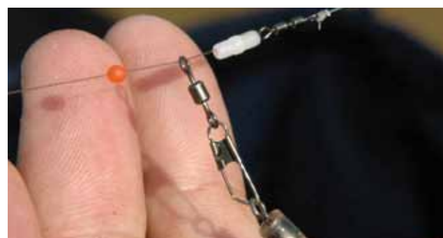
Boven de slider zit een kraal om de dobber op de stuitjes te doen stoppen. Dan volgt de slider, die via een speldwarteltje aan de hoofdlijn zit, dan weer een kraal en dan een klein tonwarteltje.