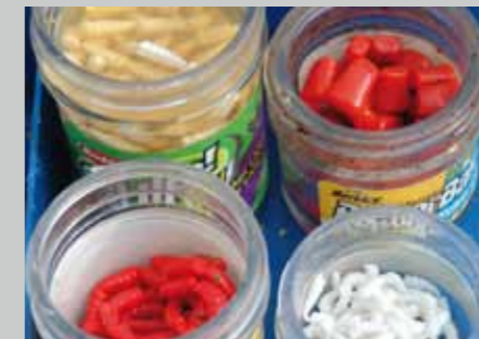
Vergis je ook niet in de vangkracht van imitatie aas: zulk spul blijft ook extra goed op de haak zitten.