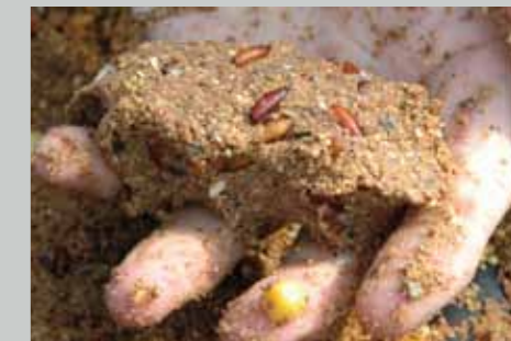
Gebruik voer dat goed plakt, zodat de ballen pas bij de bodem en niet al onderweg uiteenvallen.