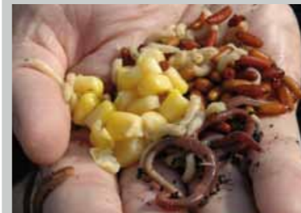
Met wat maden, casters, wormen en maïs kun je lekker variëren en allerlei verschillende aascocktails samenstellen.