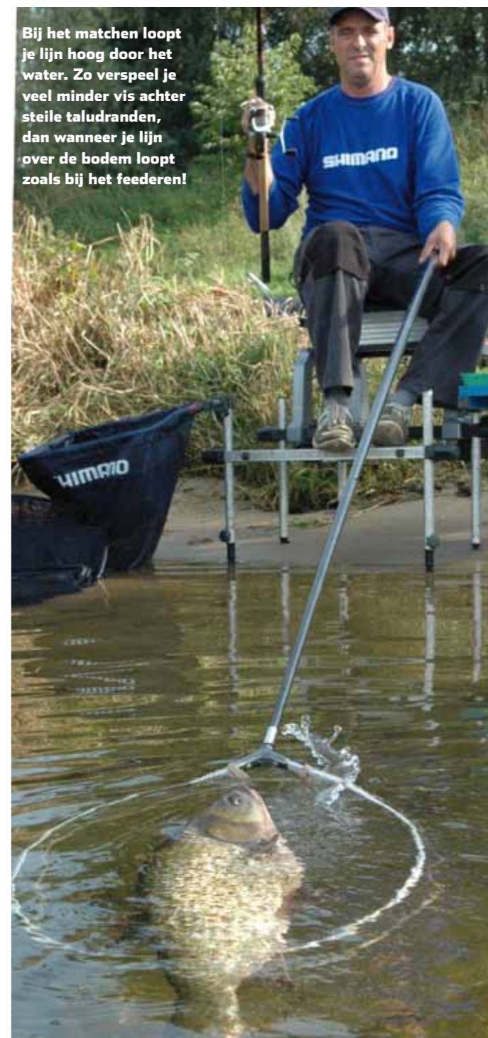
Bij het matchen loopt je lijn hoog door het water. Zo verspeel je veel minder vis achter steile taludranden, dan wanneer je lijn over de bodem loopt zoals bij het feederen!