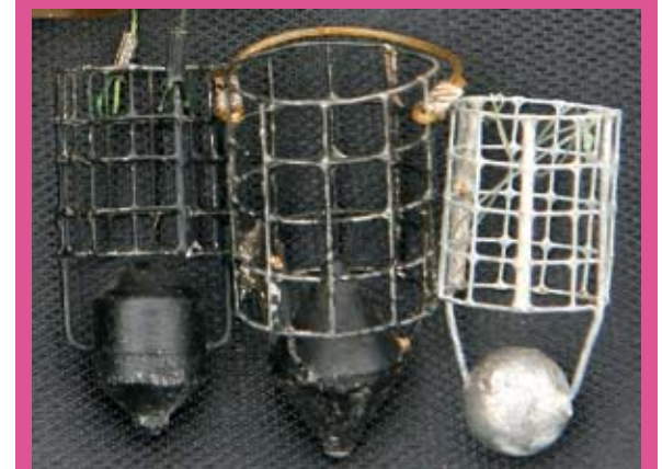
Aërodynamische speedkorven voor stilstaand water en worpen tot 40 meter. Door de plaatsing van het lood werpen deze korven als een speer. Adviesgewicht tot 30 gram.