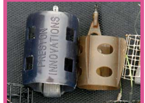
Plastic korven voor dieper, stilstaand tot lichtstromend water. Deze meer half gesloten korven houden het voer tijdens het zinken goed vast en laten het pas op de bodem los. Adviesgewicht tot 30 gram.