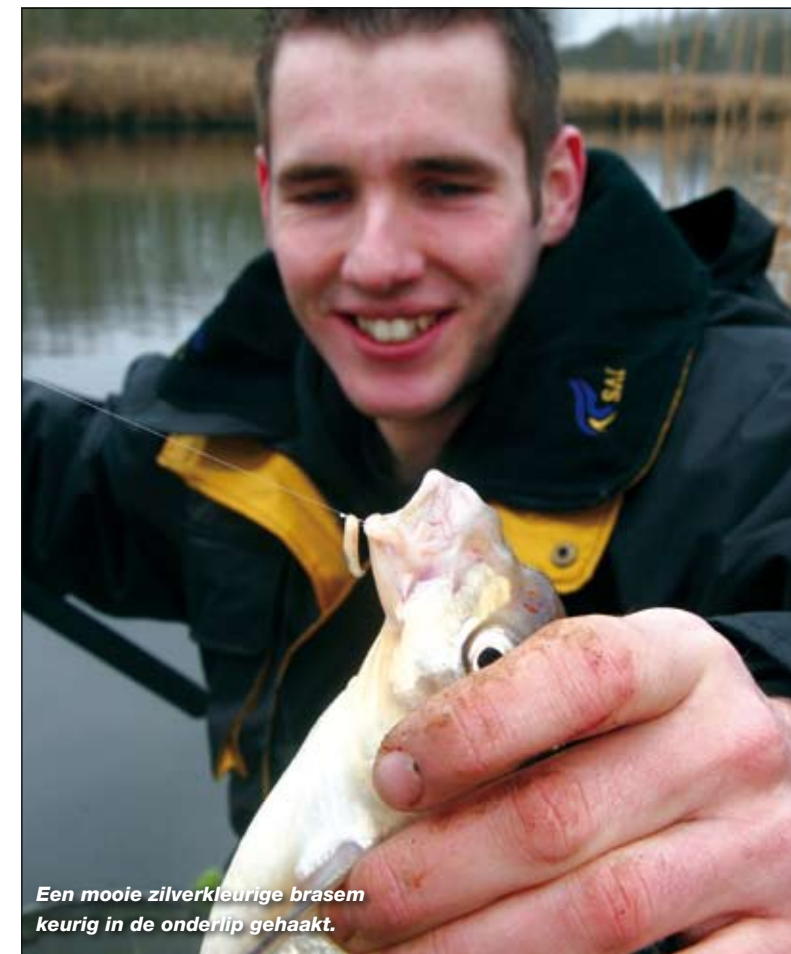
Een mooie zilverkleurige brasem keurig in de onderlip gehaakt.