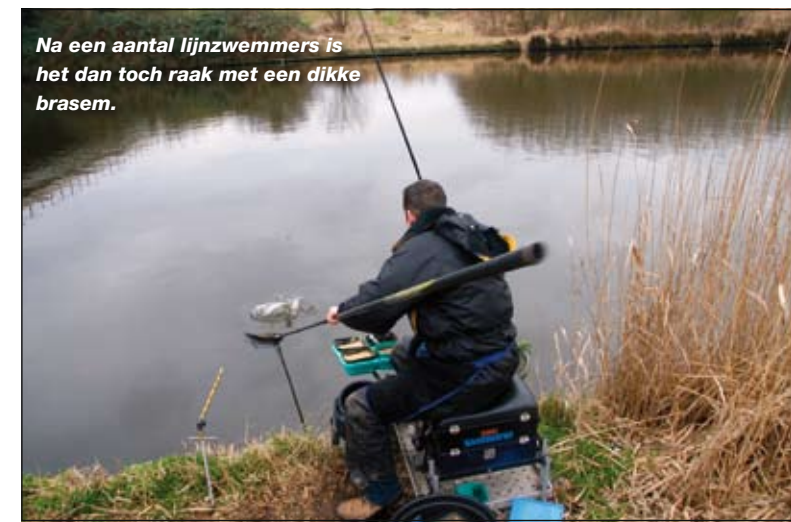
Na een aantal lijnzwemmers is het dan toch raak met een dikke brasem.

de 10 tot 15 minuten) bij te voeren – ook als je geen beet krijgt. Een stek waar helemaal geen vers voer terecht komt, trekt geen nieuwe vis aan en zal de aanwezige vis ook niet aanzetten tot azen.