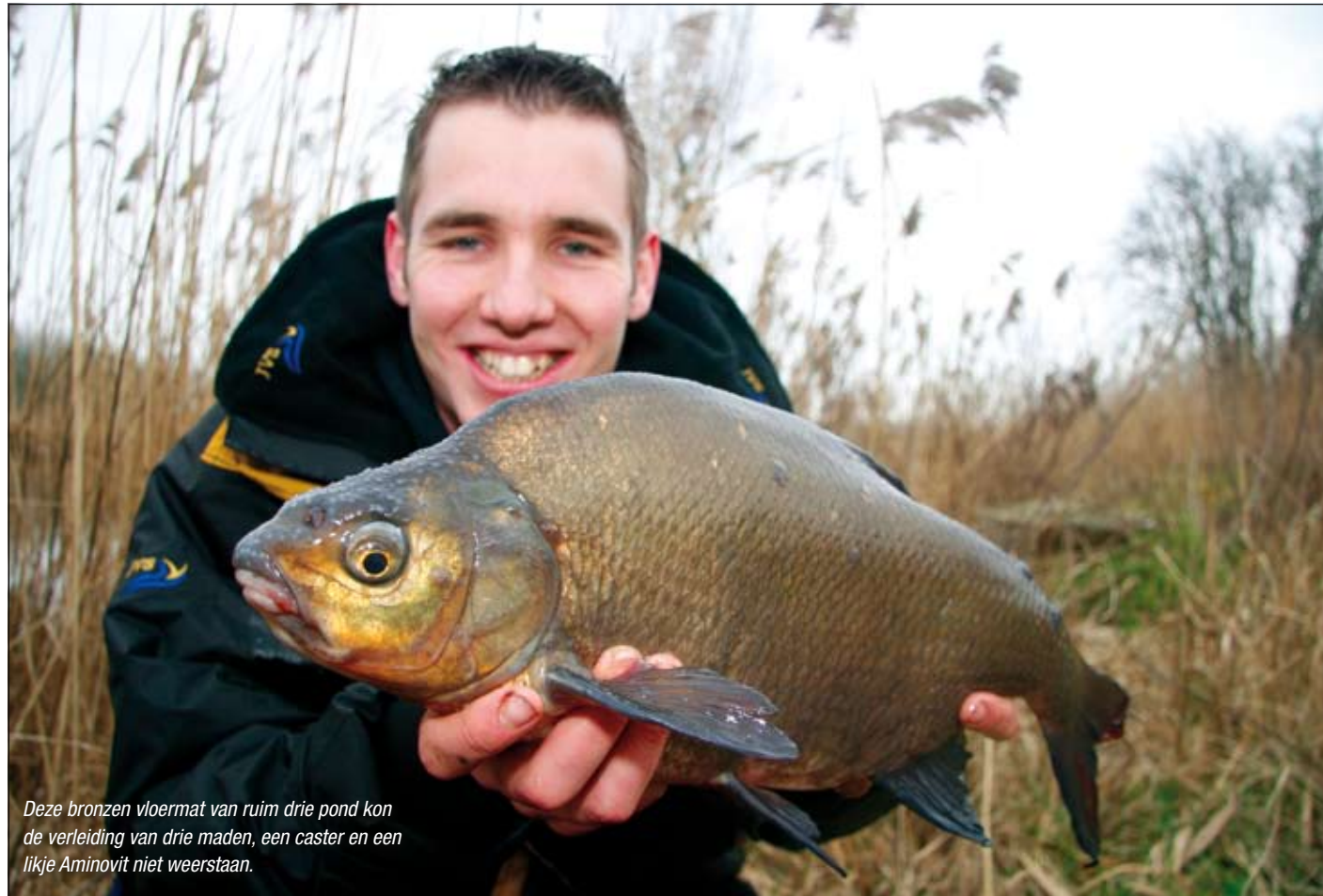
Deze bronzen vloermat van ruim drie pond kon de verleiding van drie maden, een caster en een likje Aminovit niet weerstaan.

ters, mestpieren, maïs en hennep in zijn voerbakken zitten. Vaak is succes boeken namelijk een kwestie van achterhalen welk aas, of welke aascombinatie, het die dag het beste doet.