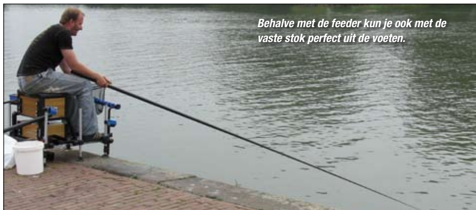
Behalve met de feeder kun je ook met de vaste stok perfect uit de voeten.

De Rijnkade is zowel met de auto als OV te bereiken. Vanuit het station houdt je iets links aan en je loopt zo langs de grote markt naar het water. Op de Rijnkade kun je prima parkeren, maar dat kost je wel twee euro per uur. Op zondag mag je je auto echter gratis achter je neerzetten.