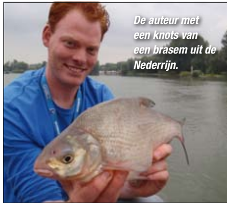
De auteur met een knots van een brasem uit de Nederrijn.

voer, bijvoorbeeld Het Gele Gevaar, een halve liter grote maden, een blik maïs en eventueel casters en pieren zit je geramd voor een lekkere sessie riviervissen vangen. Door te variëren met het aas in je voer kun je gericht bepaalde vissoorten belagen. Meer maden is goed voor voorn, winde en kolblei, geknipte pieren en maïs pak je vooral brasem.