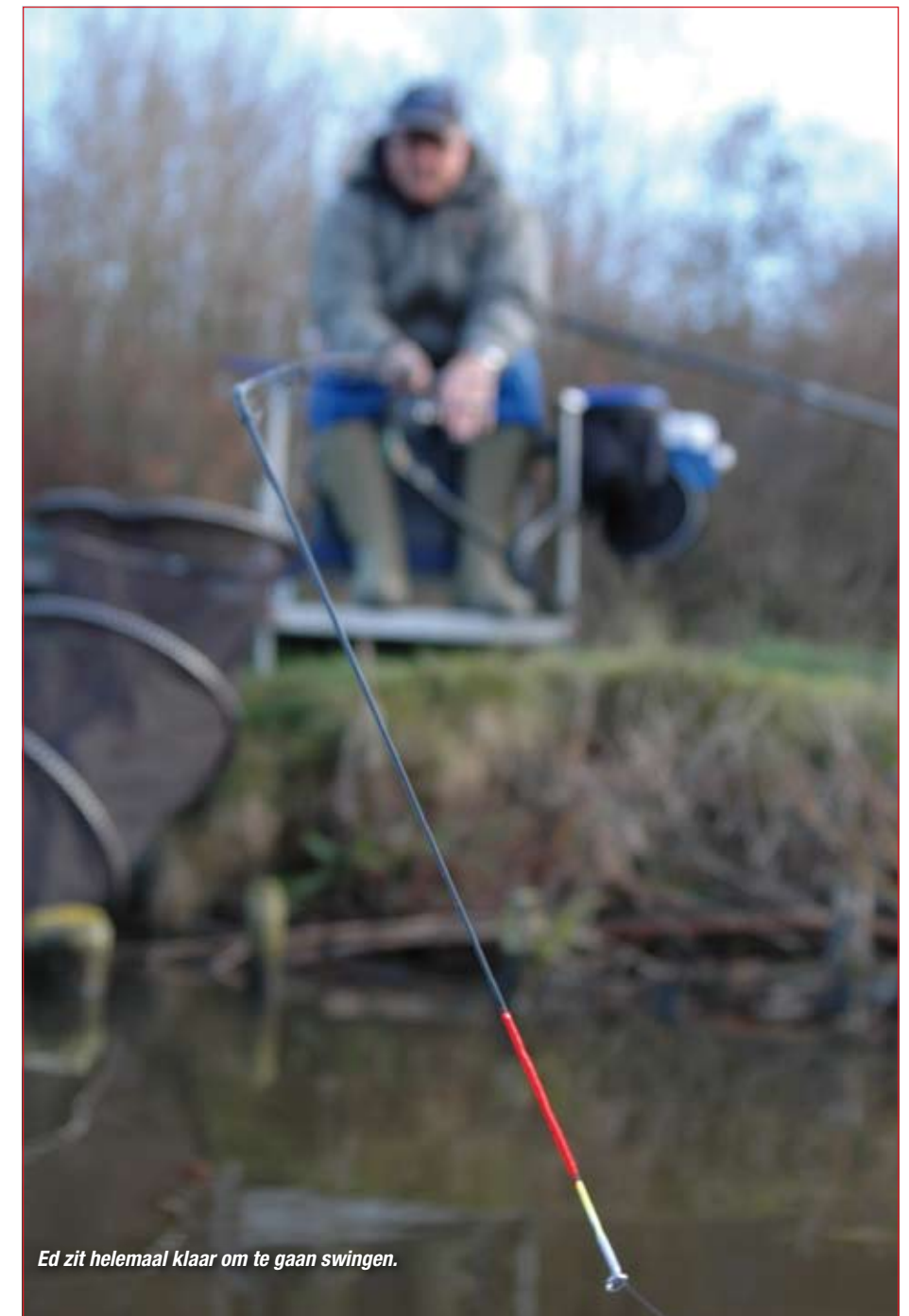
Ed zit helemaal klaar om te gaan swingen.

Lang wachten op een beet is in de winter niet ongewoon. Ik ben dan ook bijna verbaasd als na vijf minuten al de swingtip minimaal beweegt. Het was geen wind, want dat verschil is echt wel te zien. Ik wacht nog even, maar verder gebeurt er niets. Bij controle blijken de maden onaangeroerd, dus moet het een 'lijner' zijn geweest. In het volgende uur zie ik nog wat van die uiterst voorzichtige pseudobeten, maar laat ik me vooral niet verleiden aan te slaan. Elke verstoring is er immers één te veel. Pas als ik zie dat één made is gekneusd, stap ik over op plan B. Na het inwerpen draai ik de lijn nauwelijks nog strak zodat de dunne tip nu helemaal recht omlaag hangt. Weerstand is er nauwelijks nog en de vis kan zeker 20 centimeter met het aas wegzwemmen zonder ook maar iets te voelen. Op een gegeven moment zie ik twee tikjes die zo voorzichtig zijn dat ze op een feedertop waarschijnlijk onzichtbaar waren gebleven. Vervolgens loopt de swingtip heel voorzichtig een eindje op om daarna te blijven staan. Was het een lijnzwemmer, dan zou hij weer zakken. Nu hef ik de toch maar de hengel en is er werk aan de winkel voor Robert. Een mooie giebel vertelt ons dat de geruchten over een winterslaap bakerpraat zijn.