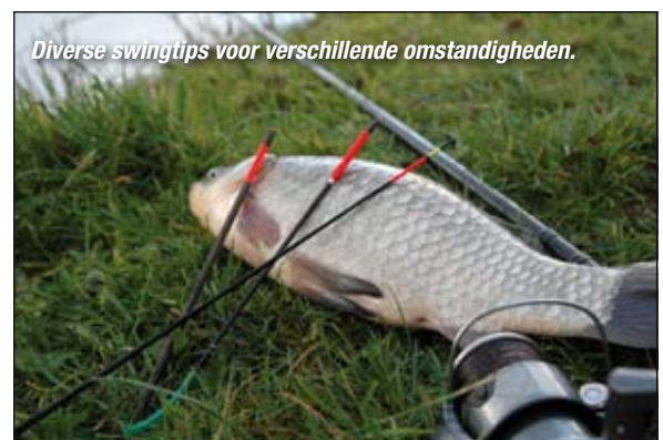
Diverse swingtips voor verschillende omstandigheden.