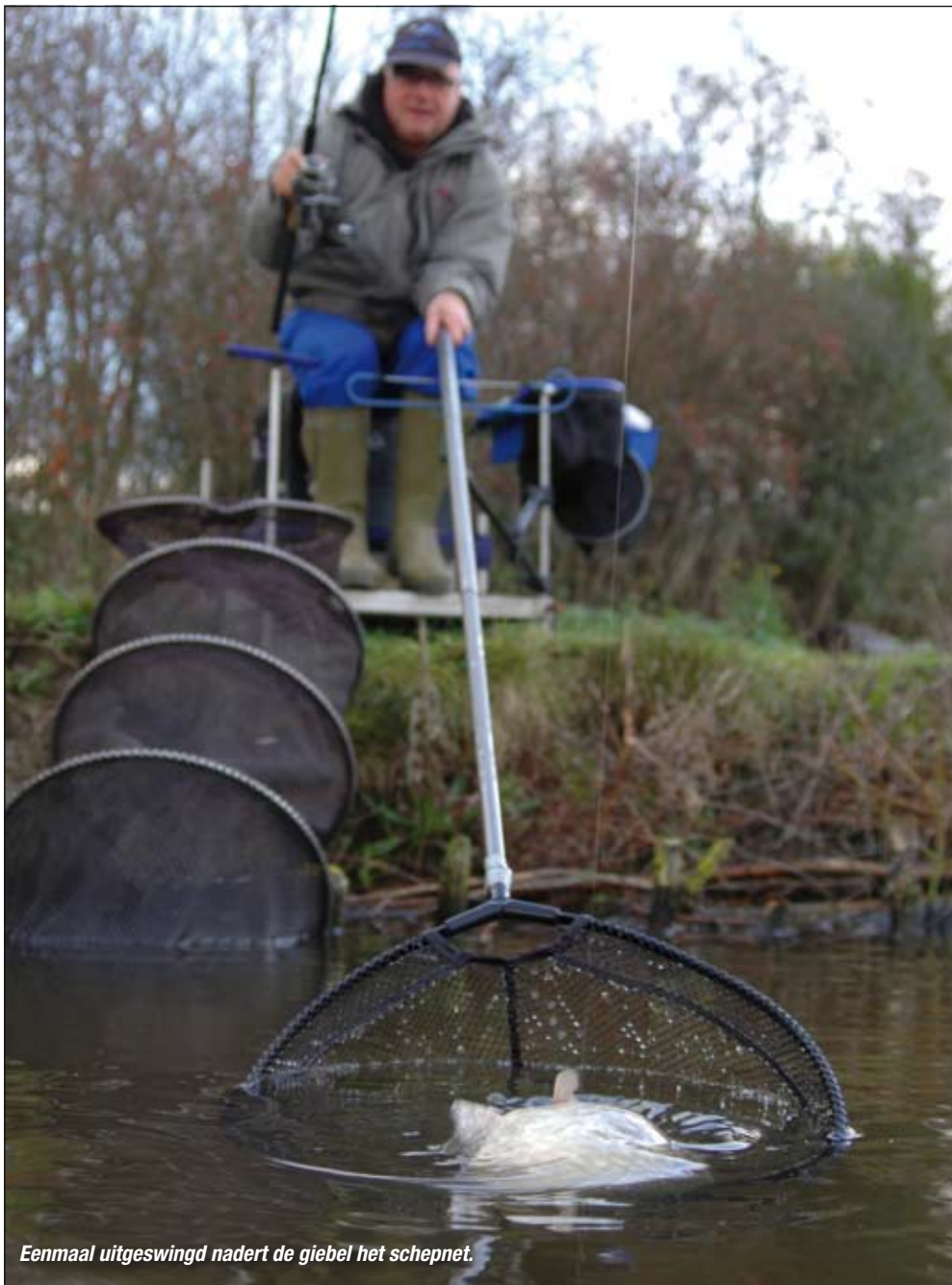
Eenmaal uitgeswingd nadert de giebel het schepnet.