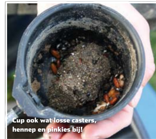
Cup ook wat losse casters, hennep en pinkies bij!