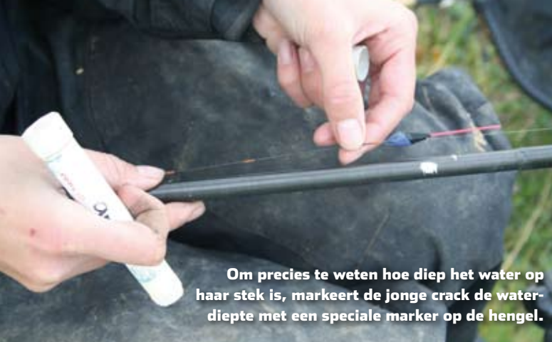
Om precies te weten hoe diep het water op haar stek is, markeert de jonge crack de waterdiepte met een speciale marker op de hengel.