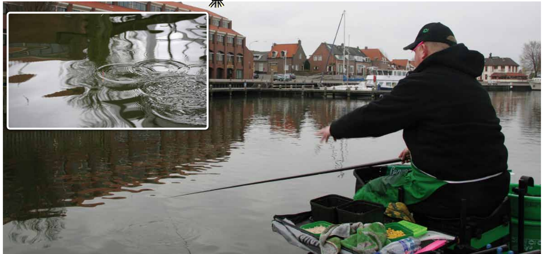
Bouw bij het bijvoeren van aas een ritme op en zorg ervoor dat je niet voorbij, maar juist voor de dobber mikt.