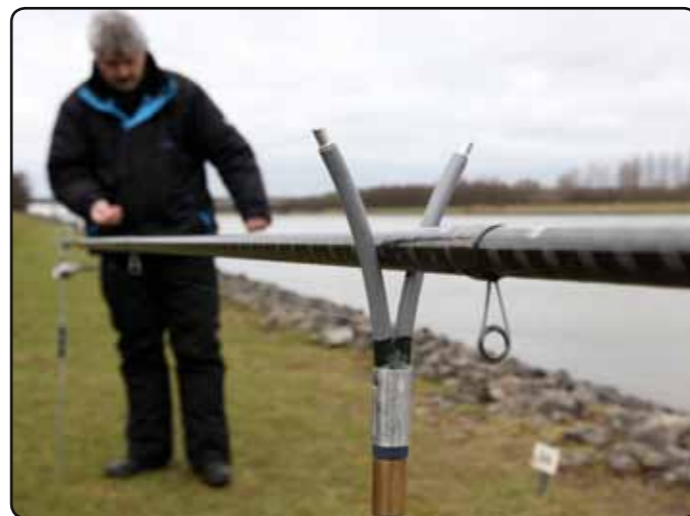
Door de lange hengel op twee op de oever gepositioneerde steunen te leggen, gaat het optuigen een stuk makkelijker.

jaren lekker mee gevist. Pas toen ik later ook op de grote rivier ging bolo vissen, werd het noodzakelijk om zwaarder te gaan. Zo vis ik op het Amsterdam-Rijnkanaal (of een grind-/zandplas) het liefst met 6, 7 of 8 gram. Maar op de Waal pak ik dobbers in de range van 8 tot 12 gram. Kijk altijd naar de omstandigheden ter plaatse bij het bepalen van je keuze. Maak niet de fout te licht te willen vissen. Waarom zwoegen met een (te lichte) 4-grams dobber als een goed uitgelood zwaarder exemplaar ook heus wel ondergaat?