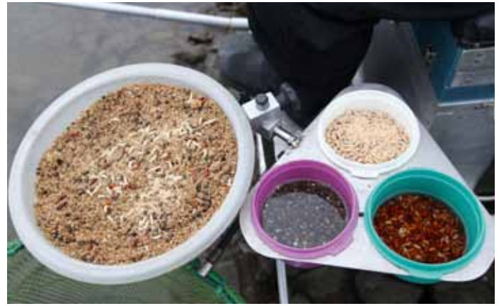
Voor een half dagje vissen moet één volle feederbak met voer genoeg zijn.

pak ik de feeder. De factoren waar je dus op moet letten zijn de weersomstandigheden, de diepte waarop je gaat vissen en de stroming.