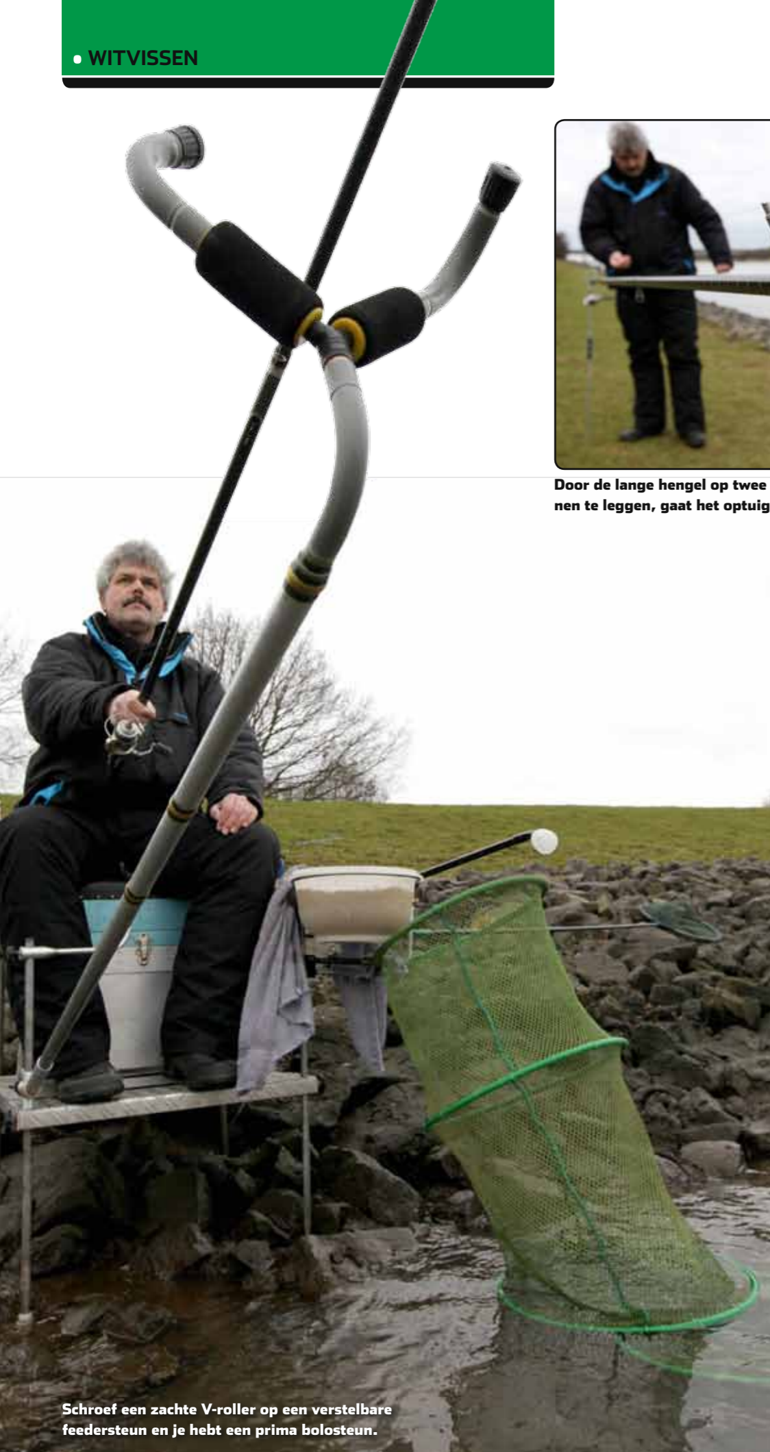
Schroef een zachte V-roller op een verstelbare feedersteun en je hebt een prima bolosteun.