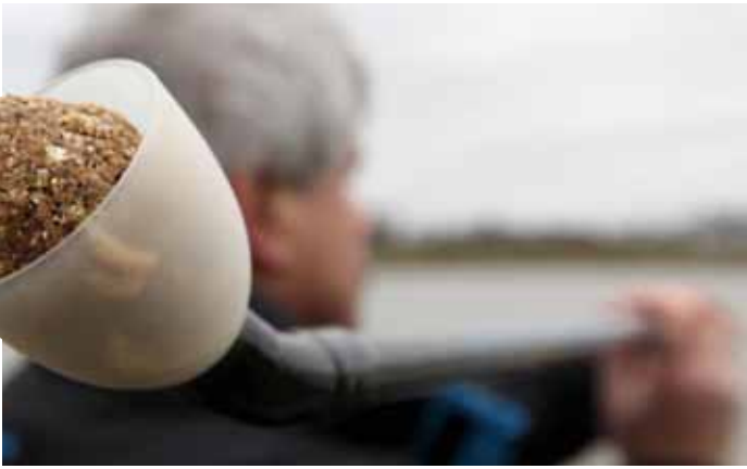
Werp aan het begin van de visdag iedere worp een klein voerballetje mee, totdat de vis op je plek is gearriveerd.

binnendraait altijd goed op de positie van je dobber. Deze laatste is namelijk eerder bij het topoog van de hengel dan je denkt!