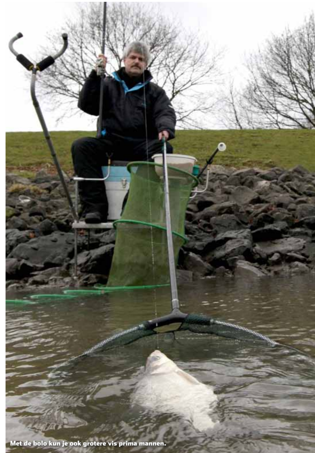
Met de bolo kun je ook grotere vis prima manen.

hengel van zeven meter kun je bijvoorbeeld prima op 5,5 meter diep water vissen. Stel nou dat je in zo'n