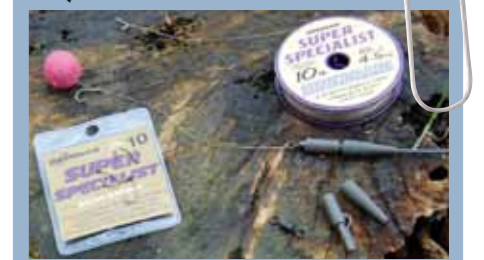
De no-knot rig is super simpel doch erg effectief; de zeelt haakt zichzelf.