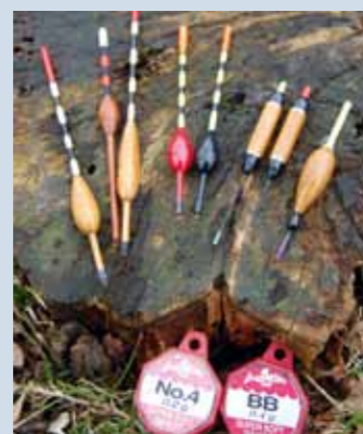
Met wat lichte pennetjes, loodhagels en haakjes 10 en 12 ben je klaar.