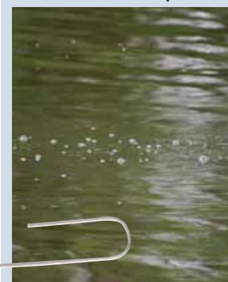
Speur het water goed af naar bellensporen. Een teken van azende zeelt.