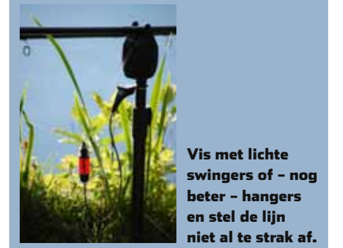
Vis met lichte swingers of – nog beter – hangers en stel de lijn niet al te strak af.