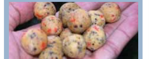
Miniboilies (8 tot 14 mm) zijn superaas.