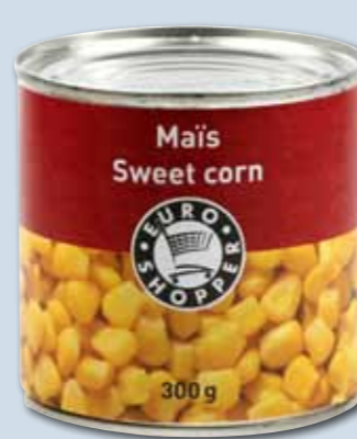
Zoete maïs uit blik is superaas. Maak hier enkele kleine voerplekjes mee.