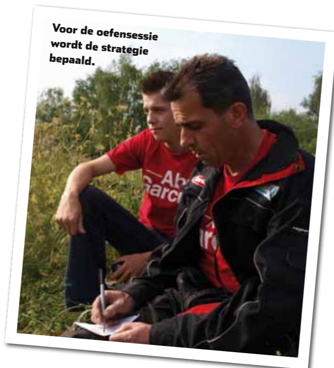
Voor de oefensessie wordt de strategie bepaald.

laconiek. Hij ligt languit in het gras en zijn blik glijdt heen en weer tussen de twee rode puntjes die dertien meter uit de kant in het water dansen. Ondertussen geniet hij van de kwetterende eenden die op het water dobberen en de avond-