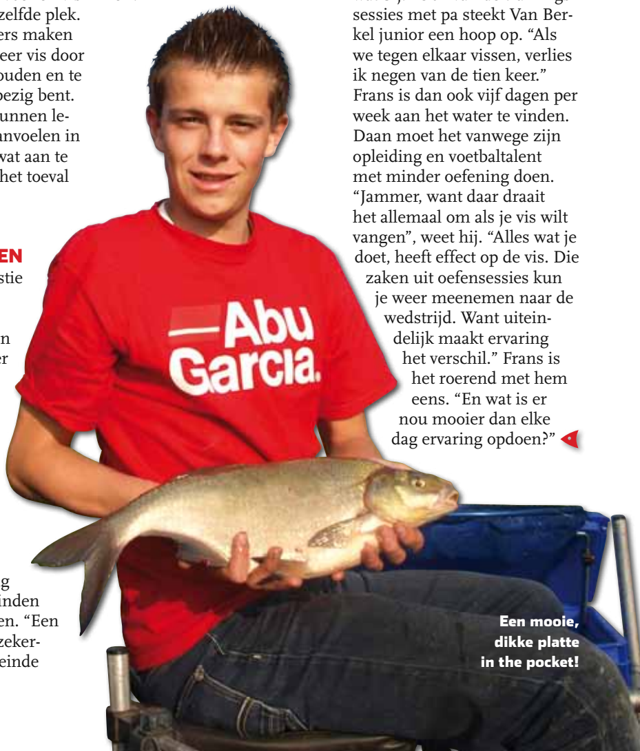
Een mooie, dikke platte in the pocket!