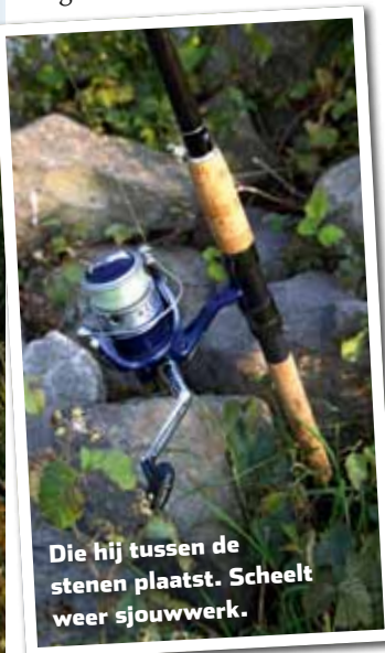
Die hij tussen de stenen plaatst. Scheelt weer sjouwwerk.