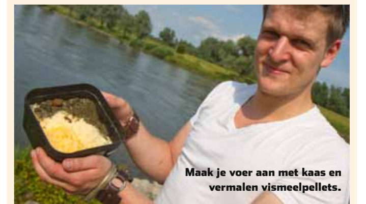
Maak je voer aan met kaas en vermalen vismeelpellets.