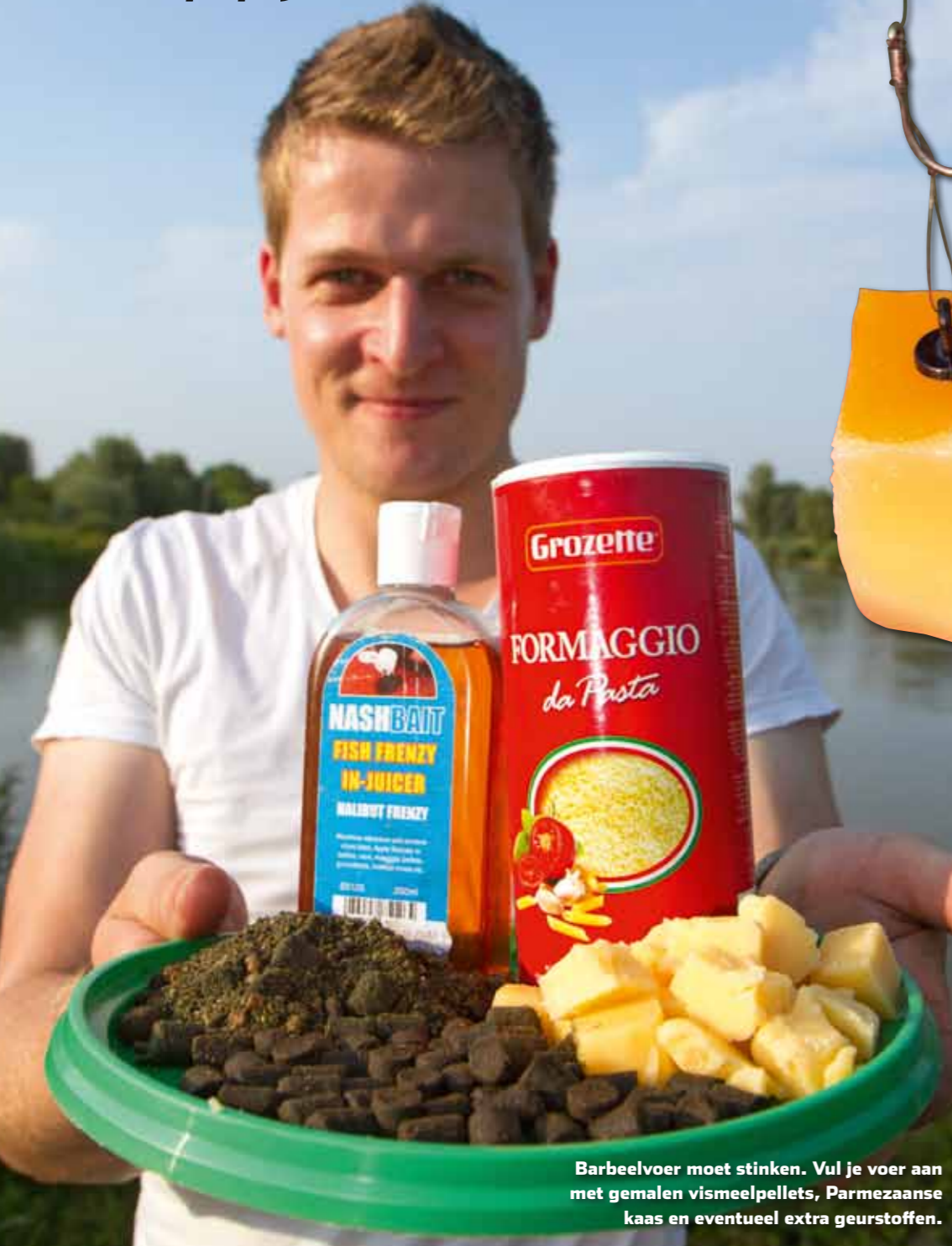
Barbeelvoer moet stinken. Vul je voer aan met gemalen vismeelpellets, Parmezaanse kaas en eventueel extra geurstoffen.

Hoofdpijndossier nr. 1 van de Visbladredactie