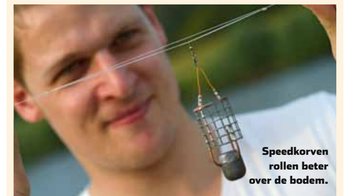
Speedkorven rollen beter over de bodem.