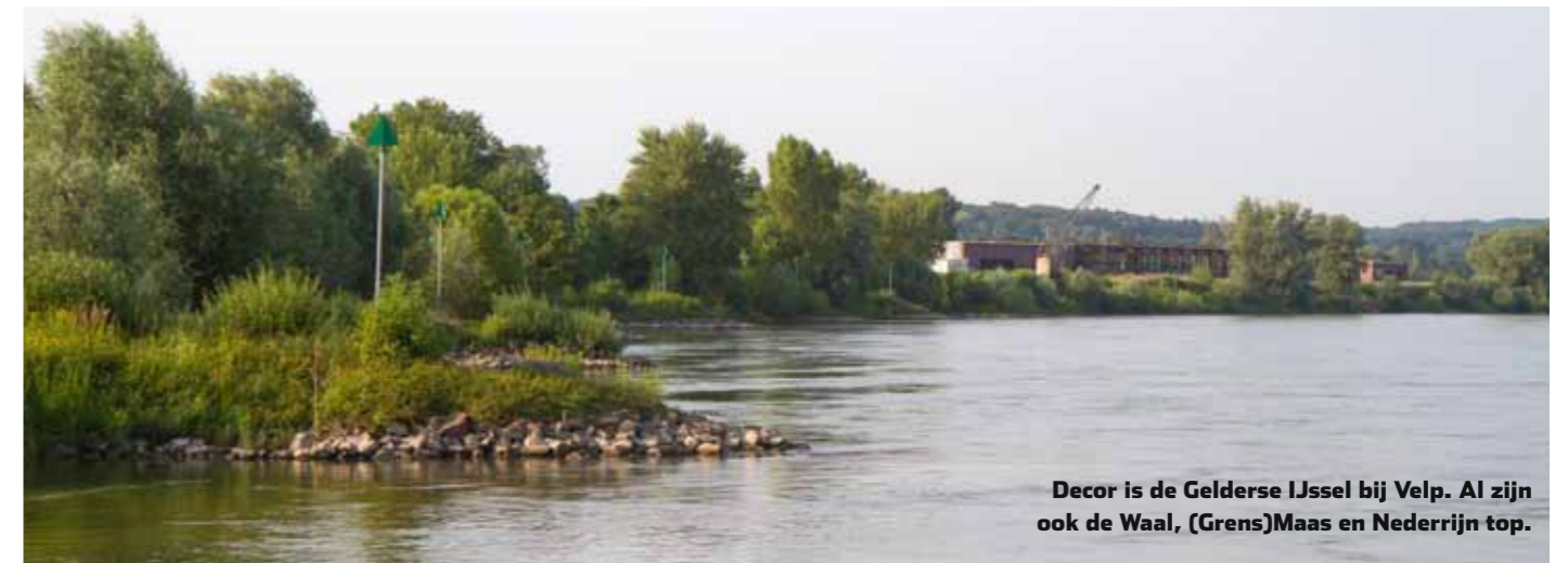
Decor is de Gelderse IJssel bij Velp. Al zijn ook de Waal, (Grens)Maas en Nederrijn top.

Als de deksel van de emmer met voer af gaat, slaan we bijna tegen de grond van de stank. "Je ruikt een mengsel van kaas en vismeelpellets. De barbeel is op allebei verzot, vandaar dat mijn voer zo sterk ruikt." Het grondvoer is een method-mix met wat vismeel