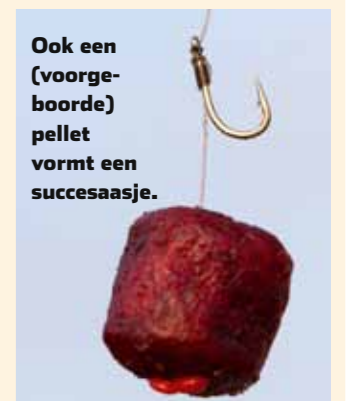
Ook een (voorgeboorde) pellet vormt een succesaasje.