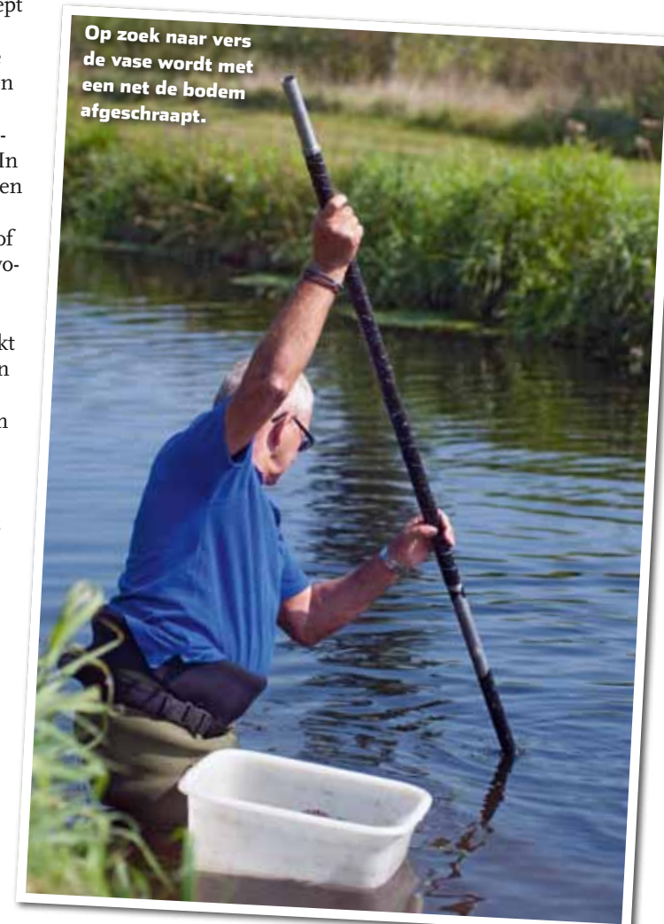
Op zoek naar vers de vase wordt met een net de bodem afgeschraapt.

Het bij nacht en ontij in het water staan, bracht Van der Bruggen ook vaak in aanra-