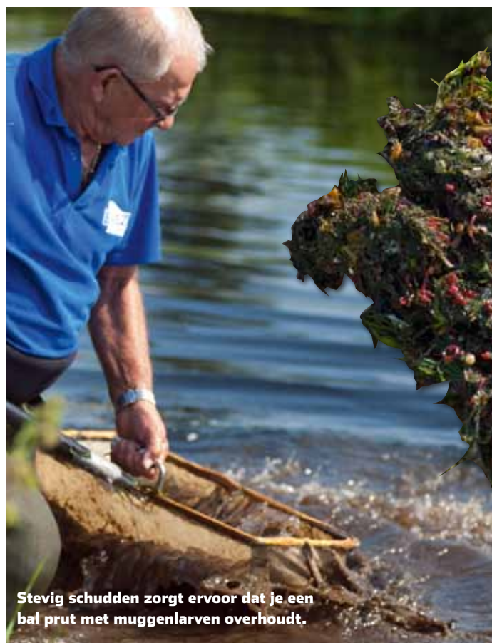
Stevig schudden zorgt ervoor dat je een bal prut met muggenlarven overhoudt.

een extra handvat gelast. Dit zorgt voor extra grip bij het schudden.