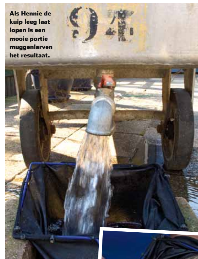
Als Hennie de kuip leeg laat lopen is een mooie portie muggenlarven het resultaat.

Om zijn vak nader toe te lichten, geeft de Geffenaar een praktijkcursus. In de betreffende sloot loost een waterzuiveringinstallatie gezuiverd afvalwater, dus het stroomt behoorlijk. Een waadpak is geen overbodige luxe. Niet alleen om in dieper water terecht te kunnen, maar ook omdat je van het geschud met modder