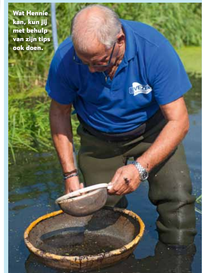
Wat Hennie kan, kun jij met behulp van zijn tips ook doen.