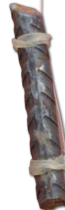
In plaats van lood kun je ook andere – milieuvriendelijkere – werpgewichten gebruiken.