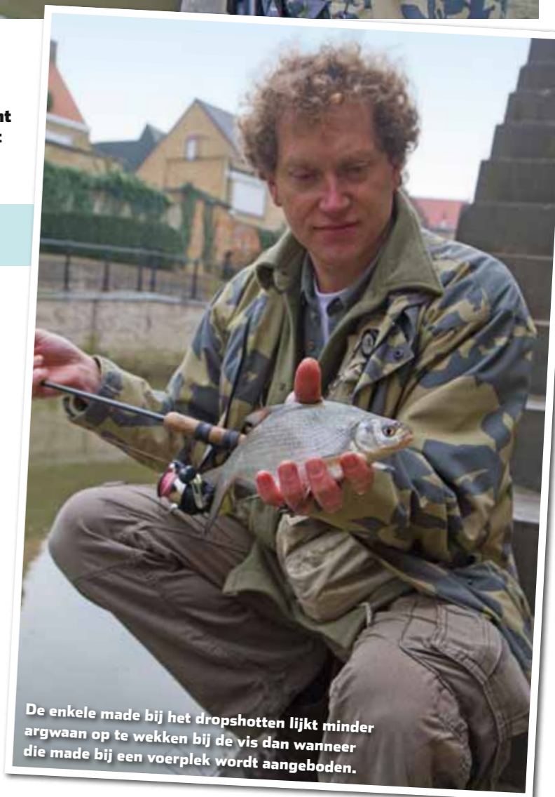
De enkele made bij het dropshotten lijkt minder argwaan op te wekken bij de vis dan wanneer die made bij een voerplek wordt aangeboden.

in de koude maanden als rustplaats dient voor hele populaties witvis – bedacht ik me hoe ik de vele gemiste aanbeten kon reduceren. De korte zijlijntjes die ik als vliegvisser gebruikte om met twee nimfen te kunnen vissen, zouden nu zeker geen nadeel vormen. Dat bleek tijdens het vissen al snel te kloppen, want een kleine drie uur later had ik 32 vissen bijeengesprokkeld. Daarbij viel het op dat de vissen erg gretig waren en de beten soms ongelofelijk hard doorkwamen – vooral de grote voorns (30 cm+) meldden zich met een tik op de hengeltop die je eerder verwacht van een ve-