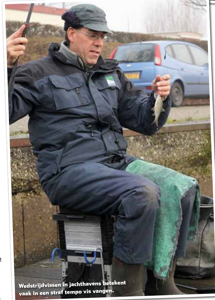
Wedstrijdvisser in jachthavens betekent vaak in een straf tempo vis vangen.