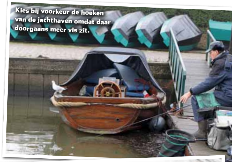
Kies bij voorkeur de hoeken van de jachthaven omdat daar doorgaans meer vis zit.

minieme aanbeten, terwijl veel heftigere rukken of opstekers een veel lager 'rendement' hadden. Ook bij een vracht aan vis op de voerplek, loont het dus om je pennetje zo nauwkeurig mogelijk uit te loden.