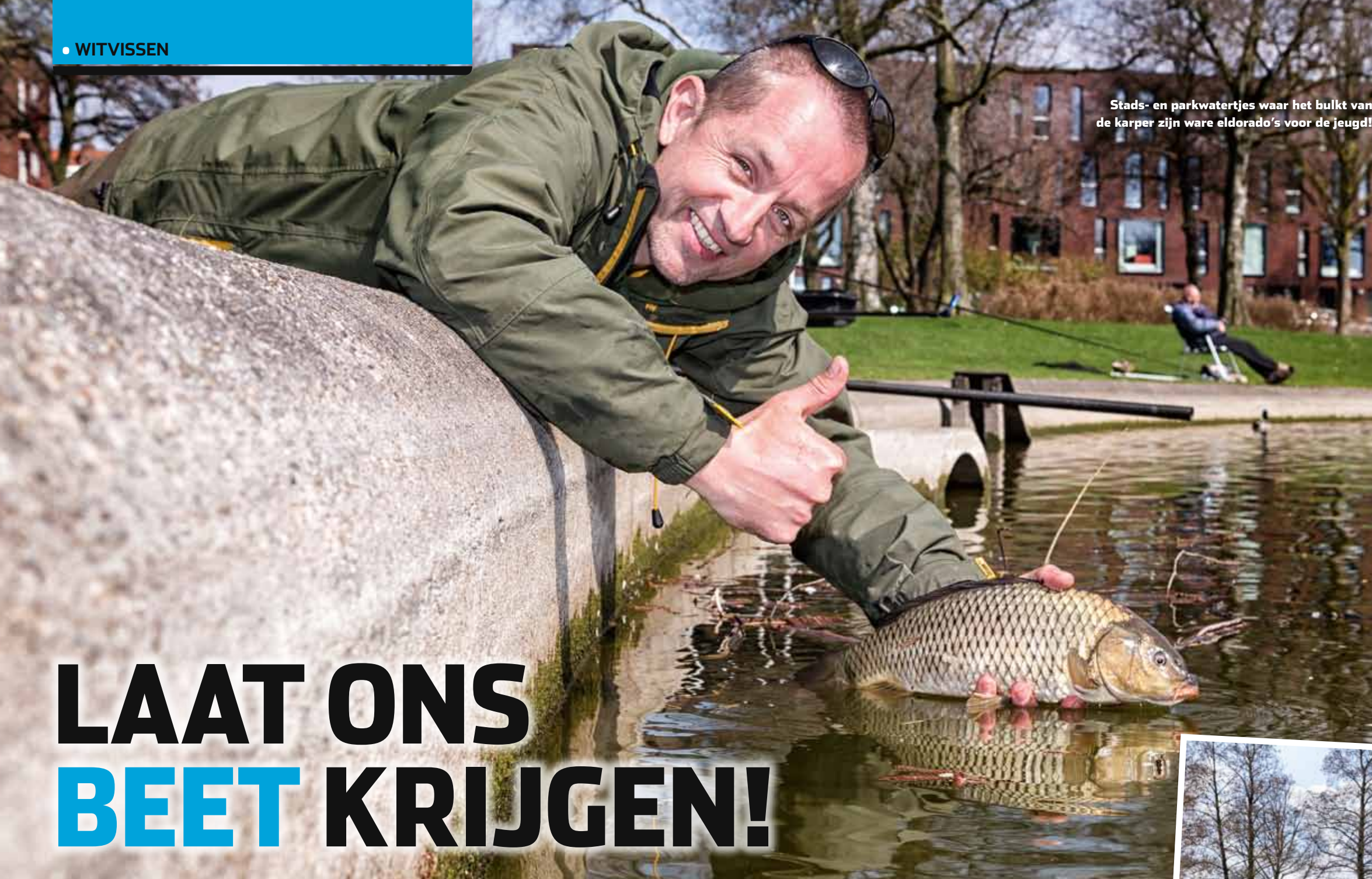
Stads- en parkwatertjes waar het bulkt van de karper zijn ware eldorado's voor de jeugd!