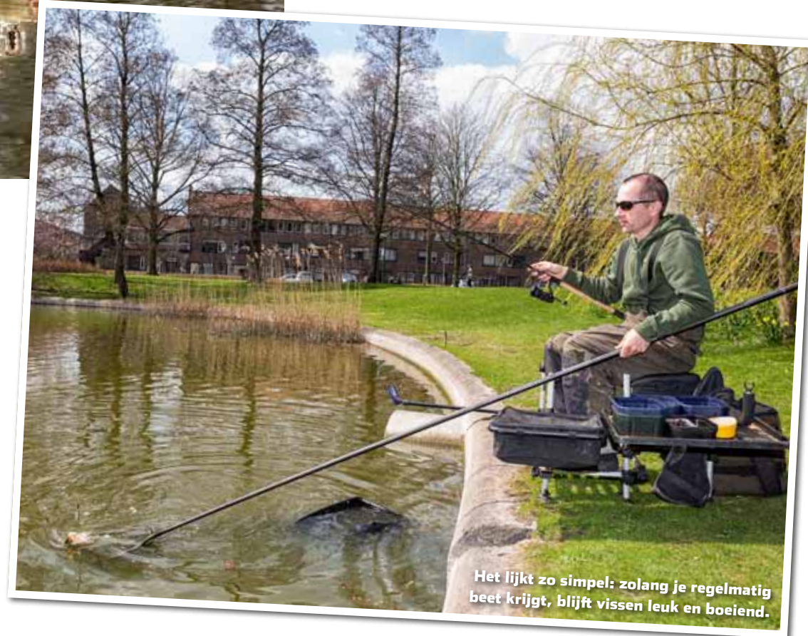
Het lijkt zo simpel: zolang je regelmatig beet krijgt, blijft vissen leuk en boeiend.

Beet krijgen is wat we allemaal willen. Het is voor velen de grootste motivatie om te gaan vissen en het verveelt werkelijk nooit. Een goed bestand aan vis is niet alleen voor een commerciële uitbater interessant, maar ook voor hengelsportverenigingen. Maar daar zit toch een adder onder het gras. Ter compensatie van dalende visvangsten op afgesloten wateren, worden er in enkele gevallen nog steeds grote partijen witvis gekocht van de beroepsvisserij.