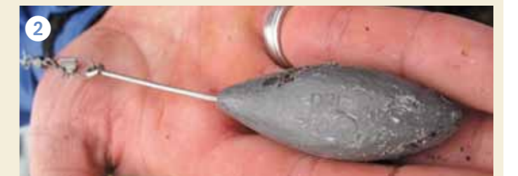
In het 'doodlopende' Calandkanaal staat meestal weinig stroming en volstaat een 'glad lood'.