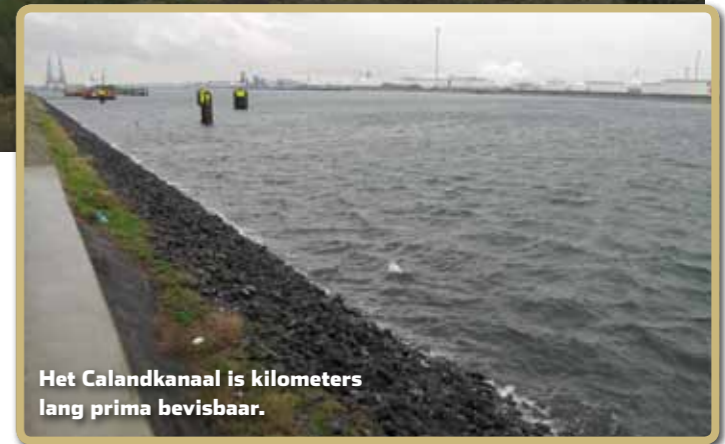
Het Calandkanaal is kilometers lang prima bevisbaar.

W ijting kan wel 60 cm worden, al heb je langs onze stranden en zoute kanalen met 40 cm al een hele knappe te pakken. Alleen vanaf de boot worden regelmatig grotere exemplaren gevangen. Voor het vangen van aantallen kun je echter gerust aan wal blijven.