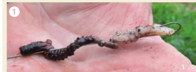
Voor de grotere wijting is een cocktail van een zeepier en een reepje makreel altijd prijs.