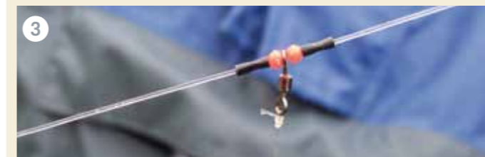
Ver werpen = meer vis. Vis daarom bij voorkeur zonder afhouders, die ver werpen belemmeren.