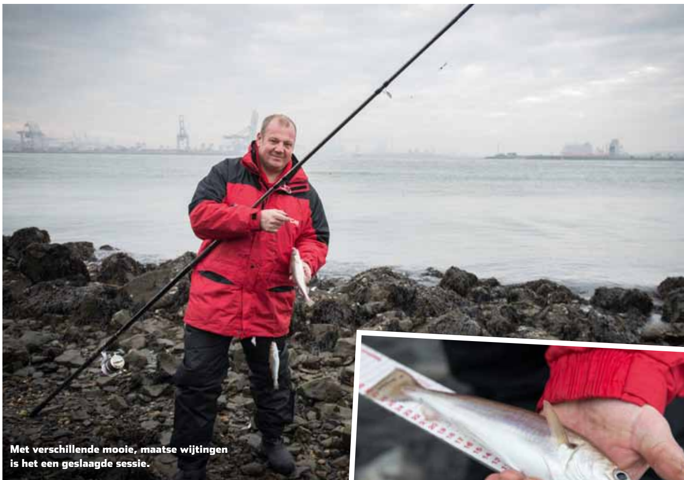
Met verschillende mooie, maatse wijtingen is het een geslaagde sessie.