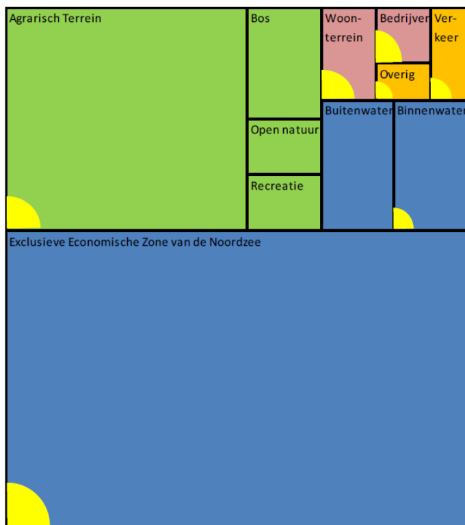
Figuur 2.1 Potentieel gebruik van bodem en wateroppervlak voor zonne-energie in Nederland in 2050. Het geel gemarkeerde deel geeft een indicatie van het voor PV te gebruiken areaal (bron: Folkerts et al. 2017).