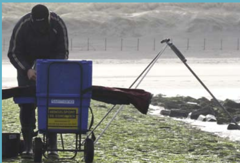
Een karretje, plastic zeeviskist en stevige driepootsteun zijn onmisbaar om ontspannen vanaf strekdammen te vissen.

Vis je bij opkomend water op een strekdam, houd dan altijd goed je spullen in de gaten. Het water komt namelijk sneller op dan je denkt. Om je kist en spullen droog te houden is het gebruik van een karretje en een stevige driepoot hengelsteun aan te bevelen. Hang eventueel een emmer met water aan de driepoot, zodat deze niet omvalt door golven en wind. Goede schoenen of een waadpak met grip zijn een pré op strekdammen. De stenen kunnen spekglad zijn door alg- of wieraanslag en gelijk bij je eerste worp onderuit gaan is geen fijne start van je visdag.