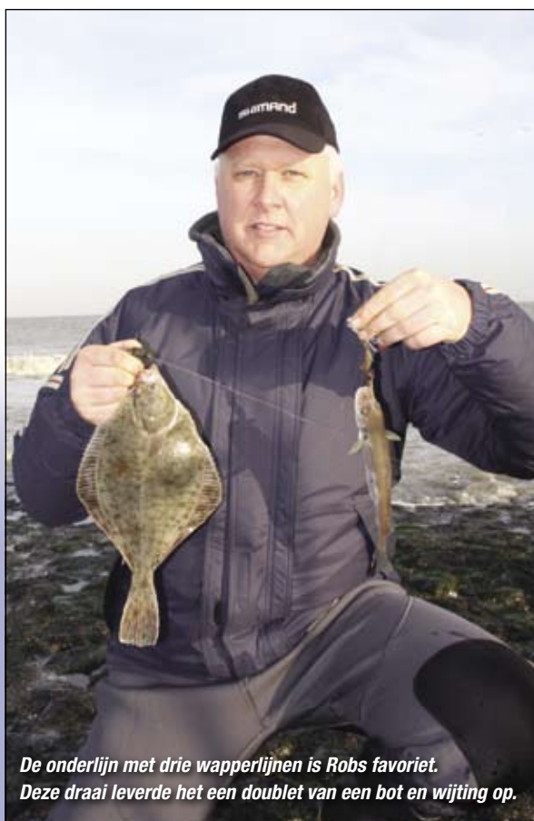
De onderlijn met drie wapperlijnen is Robs favoriet. Deze draai leverde het een doublet van een bot en wijting op.