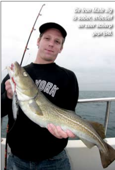
De Iron Mate Jig is sober, effectief en zeer scherp geprijsd.

vastraken dus meer vis (zie Hét Visblad februari 2008 pag 18). Bij elkaar testten wij een dozijn pilkers van 60 tot 150 gram en waren meer dan tevreden. Hieronder de belangrijkste criteria waarop we de loodvrije pilkers hebben getest: