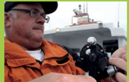
7.32 uur: het is direct raak en de 18/00 gevlochten hoofddijn wordt flink op de proef gesteld als de vis het wrak in wil duiken.