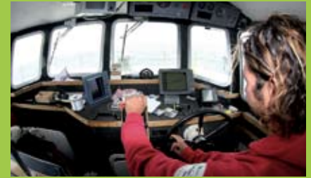
7.25 uur: de Specialist II arriveert na ruim een uur varen bij het eerste wrak.