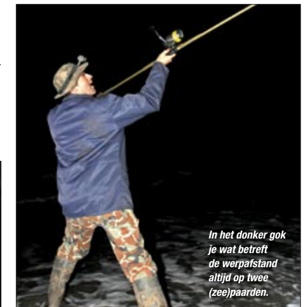
In het donker gok je wat betreft de werpafstand altijd op twee (zee)paarden.

Verwerpen is bij deze visserij lang niet altijd nodig – zeker niet bij opkomend water. Vis, en zeker ook bot, gaat na zonsondergang vaak dicht onder de kant op zoek naar prooi. Wanneer je met twee hengels vist, werp er dan een ver en een dichtbij in om goed te kunnen bepalen waar de actieve vis zit. Zeevissers zijn natuurlijk altijd met de getijden in de weer, maar in het donker moet je extra goed weten wat je doet en niet verrast worden door de vloed. Raadpleeg daarom altijd de getijdentabel en ga in het donker alleen daar vissen waar je goed bekend bent. ■