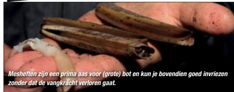
Mesheften zijn een prima aas voor (grote) bot en kun je bovendien goed invriezen zonder dat de vangkracht verloren gaat.