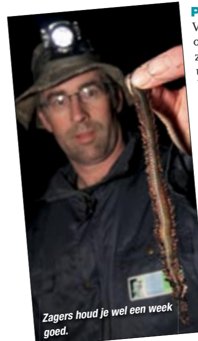
Zagers houd je wel een week goed.

Voor een paar uurtjes vissen heb je geen overdreven hoeveelheid aas nodig. Met 75 zeepiëren of twee ons zaggers kom je zeker uit. Zeepiëren vangen het beste, maar zijn beperkt houdbaar. Zaggers houd je – mits koel bewaard – daarentegen meer dan een week in leven. Naarmate ze langer in een krant verpakt zitten beginnen ze steeds minder aangenaam te geuren; de vangkracht neemt dan echter alleen maar toe. Een ander goed aas voor met name grote bot, alsook voor gul en zeebaars, zijn mesheften, messen, messchelpen, tafelmessen of hoe je ze ook wilt noemen. Vers zijn ze stevig en blijven ze prima op de haak zitten, ook bij ferme worpen. Ingevroren en ontdooid zijn mesheften een uitstekend aas, alleen zijn ze dan slapper en heb je bindelastiek nodig om ze op de haak te houden. Met een partij ingevroren mesheften heb je echter wel altijd aas op voorraad.