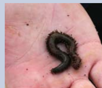
Slikzagerijtjes zijn Arjan's favoriete aas.