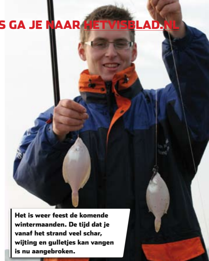
Het is weer feest de komende wintermaanden. De tijd dat je vanaf het strand veel schar, wijting en gulletjes kan vangen is nu aangebroken.

werp voordat ik begin met vissen eerst een licht werplodje over de stek om te kijken of er geen obstakels liggen. Liggen die er niet, dan is het zeker mogelijk om met zo'n dunne hoofdlijn te vissen. Liggen er wel obstakels, dan schakel ik over naar een nog steeds relatief dunne 25/00 tot 30/00 nylon hoofdlijn."