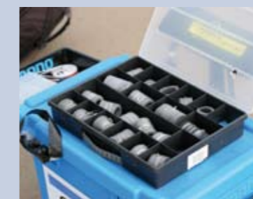
Rolletjes van buizenfoam: ideaal om je onderlijnen overzichtelijk en zonder klitten op te bergen.