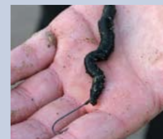
Zeepieren schuif je met een aasnaald over de haak op de lijn. Zo kun je lekker veel aas gebruiken.