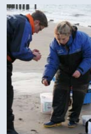
Echte liefde is...een zeepier voor je vriend op de haak schuiven.