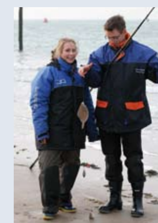
Liefde is ook je vriendje laten zijn dat de vis dichterbij zit dan je denkt!