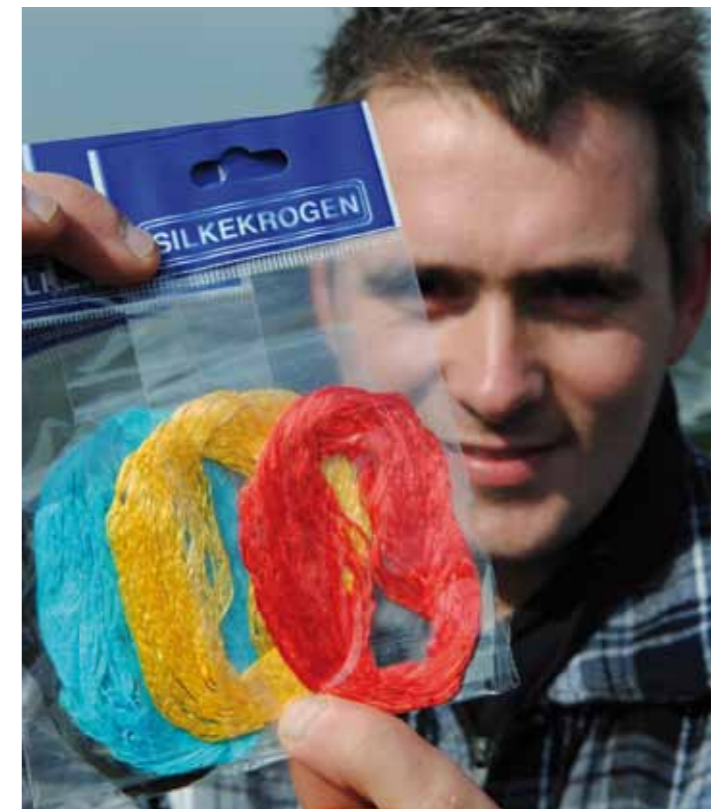
Silkekrogen: een lusje van zeer fijne zijden draadjes zonder haak, waar de geep met zijn tandjes toch in blijft haken.

In Nederland is Silkekrogen nog moeilijk verkrijgbaar. Dit Deense goedje is in ieder geval verkrijgbaar bij BHC in Breda. Een andere optie is om het Silkekrogen per e-mail via de Deense website www.silkekrogen.dk te bestellen.