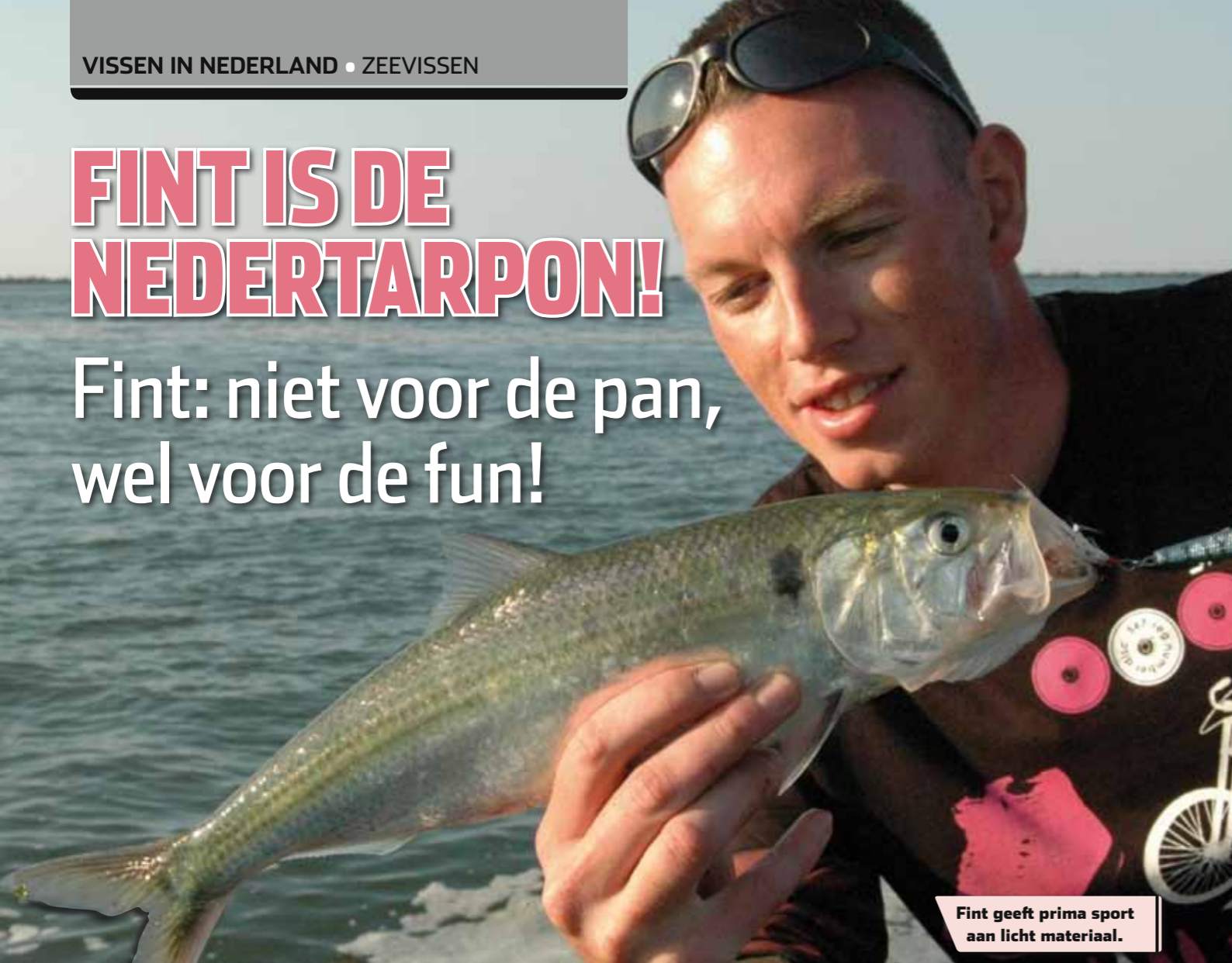
Fint geeft prima sport aan licht materiaal.

Fint: niet voor de pan, wel voor de fun!