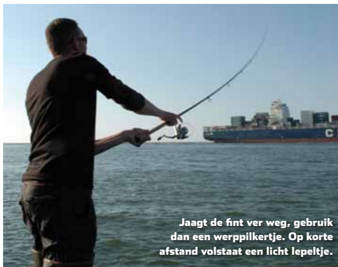
Jaagt de fint ver weg, gebruik dan een werppilkertje. Op korte afstand volstaat een licht lepelkje.

Met zijn ver uitstulpbare bek jaagt fint vooral op zeebleik; de verzamelnaam voor jonge haring, sprot en spiering. Vaak gebeurt dat aan of net onder het wateroppervlak. Een sensationeel gezicht, zeker als een hele school van honderden finten tegelijk op jacht is. Spuur het water af naar het gespetter waarmee dit gepaard gaat en je hebt doorgaans binnen no-time jagende fint gelokaliseerd. In plaats van