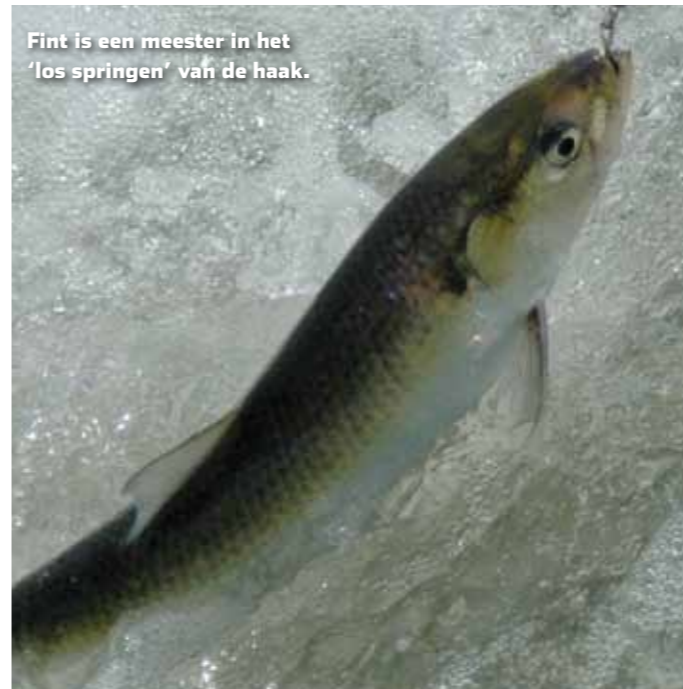
Fint is een meester in het 'los springen' van de haak.

zijn namelijk spekglad door wier en algen. Laarzen met gripnokken of 'spikes' zijn dan ook geen overbodige luxe.