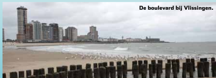
De boulevard bij Vlissingen.

Adres: President Rooseveltlaan (parking), Boulevard Bankert, Boulevard de Ruyter; Vlissingen