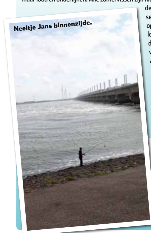
Neeltje Jans binnenzijde.